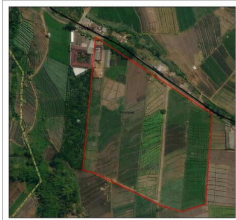
Gambar SEQ Gambar 1 ARABIC 2 Area Perencanaan Wisata Agrowisata dan Atraksi Budaya, Desa Torongrejo

Area perencanaan yang berada di lingkungan wisata agrowisata dan atraksi budaya ditinjau dari pencapaian berjarak \pm 5 km dari Jalan raya. Jalur sepanjang jalan menuju ke wisata agrowisata dan atraksi budaya memiliki lebar kurang \pm 4 m dan pada beberapa bagian jalan masih terdapat bahu jalan selebar 1-2 m di sisi kiri dan kanan sehingga lebar jalan masih dapat diperlebar untuk mempertimbangkan peluang meningkatnya traffic akibat adanya tempat wisata baru. Hal ini menjadi penting karena pengalaman dari baloga jatimark 4 luasan dan lebar jalan yang kecil dapat menimbulkan kemacetan di pintu masuk/ keluar cukup Panjang