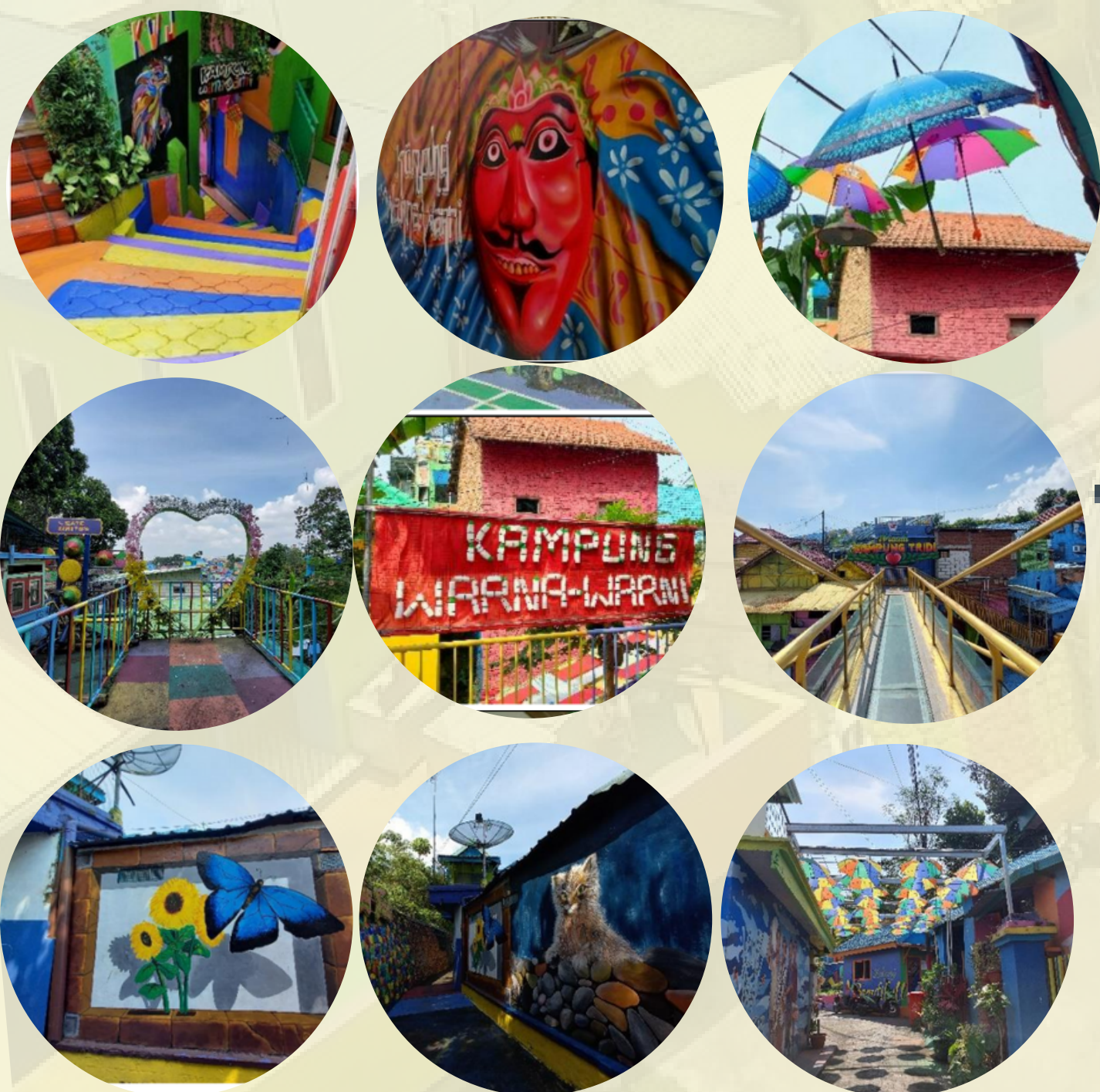
● Spot Foto

Kampung Warna Warni dapat dinikmati jarak jauh dan dekat dengan keanekaragaman sudut pandang dan objek wisata yang berbeda dan menarik. Terdapat beberapa cluster sebagai lokasi spot foto maupun keragaman daya tarik wisata didalam kampung.