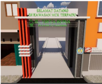
Gambar 2. Detail Konstruksi Rancang Bangun Gapura

Green Design sebagai Upaya Pembentuk Identitas suatu Lingkungan . Jurnal Desain Interior , 21-26.