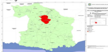
Gambar 2. Peta Aglomerasi Kesenjangan Ekonomi Wilayah Malang Raya

Pengembangan wilayah di Kawasan Metropolitan terutama Malang Raya adalah kesenjangan antara daerah dimana pembangunan di monosentris, terpusat pada Kota Malang.