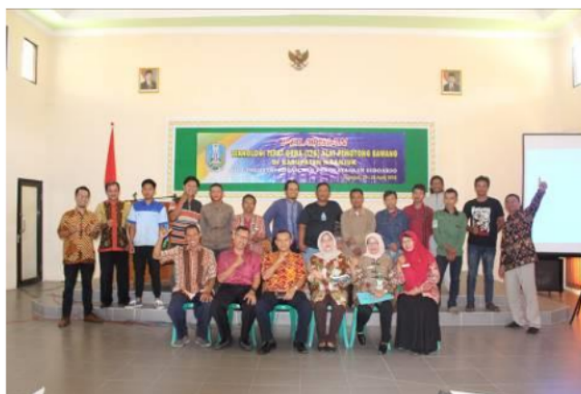
Gambar 3. Dokumentasi tim abdimas dengan peserta pelatihan