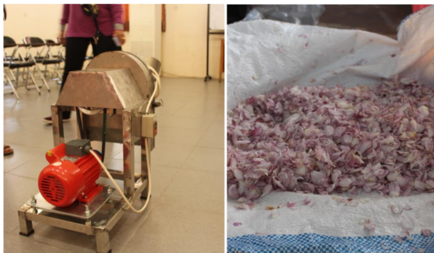
Gambar 5. Mesin setelah di rakit dan hasil rajangan bawang merah

dirakit kemudian dilakukan trial, untuk langkah awal percobaan penggeraknya dilakukan secara manual menggunakan tangan. Untuk selanjutnya setelah tidak ada kendala percobaan berikutnya menggunakan motor.