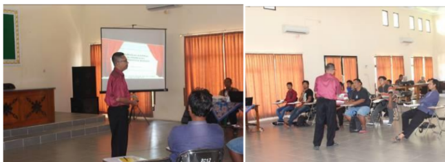
Gambar 2. Tahap Pemberian materi pengetahuan bahan logam oleh tim