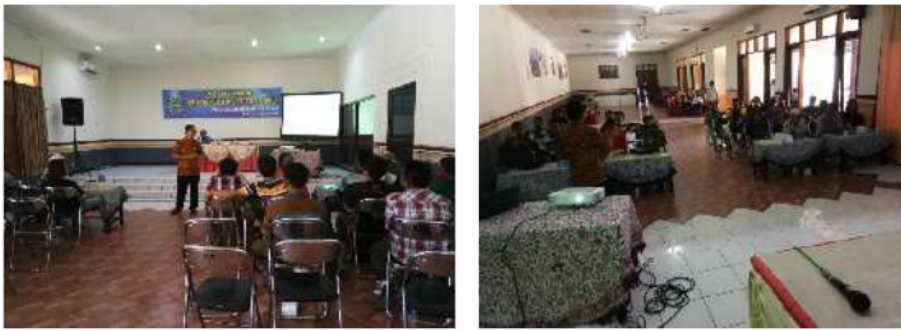
Gambar 2. Tim Pengabdian Masyarakat Memberikan Materi mengenai Logam dan Pengecoran Aluminium