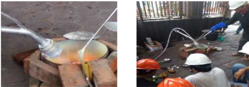
Gambar 6 Proses peleburan aluminium dan proses penuangan ke dalam pola cetakan

Sesi kedua adalah praktek pengecoran dari masing masing peserta, seperti terdokumentasi dalam Gambar 6 dan 7.