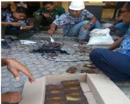
Gambar 3. Tim Pengabdian Masyarakat memberikan panduan dalam membuat pola cetakan dengan pasir resin

Untuk pelaksanaan kegiatan praktek di bagi menjadi 2 (dua) sesi, sesi pertama digunakan untuk memberikan penjelasan mengenai cara membuat cetakan dari pasir resin yang kemudian dilanjutkan dengan mempraktekkan pembuatan pola dari pasir resin oleh masing masing peserta (Gambar 3), termasuk didalamnya adalah proses penyiapan alat alat dan bahan yang diperlukan seperti ditunjukkan Gambar 4.