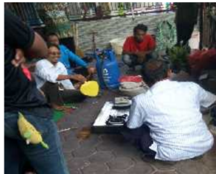
Gambar 4. Persiapan Alat dan Bahan Pengecoran Ulang Aluminium

Pola yang disediakan masih sederhana dengan harapan akan bisa memancing kreasi dari pada peserta untuk dapat membuat dan mendesain sendiri pola pilihan sesuai dengan kreasi dari masing-masing peserta. Untuk tahap awal pola yang di pilihkan berupa sebuah gantungan kunci sederhana yang bertuliskan "Madiun", seperti pada gambar 5.