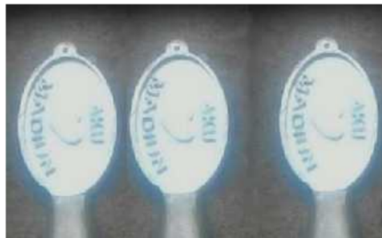
Gambar 7. Hasil pengecoran aluminium