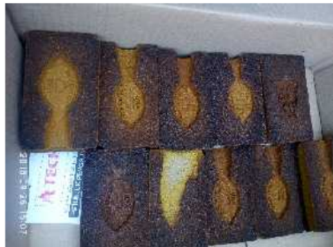
Gambar 5 Hasil pembuatan pola cetakan

Sesi kedua adalah praktek pengecoran dari masing masing peserta, seperti terdokumentasi dalam Gambar 6 dan 7.