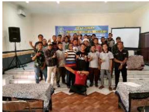
Gambar 1. Peserta Pelatihan bersama Tim Pengabdian Masyarakat

Adapun pelaksanaan teori dari kegiatan Pengabdian kepada Masyarakat ini terdokumentasi pada Gambar 1 dan 2 dibawah ini.