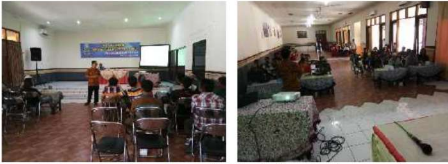
Gambar 2. Tim Pengabdian Masyarakat Memberikan Materi mengenai Logam dan Pengecoran Aluminium