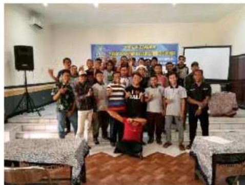
Gambar 1. Peserta Pelatihan bersama Tim Pengabdian Masyarakat

Adapun pelaksanaan teori dari kegiatan Pengabdian kepada Masyarakat ini terdokumentasi pada Gambar 1 dan 2 dibawah ini.