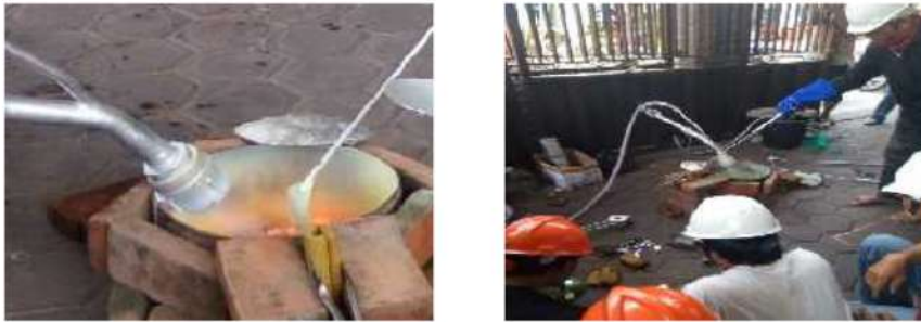
Gambar 6 Proses peleburan aluminium dan proses penuangan ke dalam pola cetakan

Sesi kedua adalah praktek pengecoran dari masing masing peserta, seperti terdokumentasi dalam Gambar 6 dan 7.