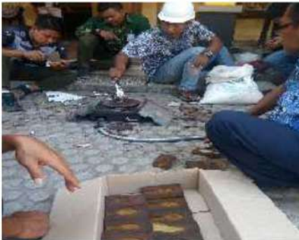
Gambar 3. Tim Pengabdian Masyarakat memberikan panduan dalam membuat pola cetakan dengan pasir resin

Untuk pelaksanaan kegiatan praktek di bagi menjadi 2 (dua) sesi, sesi pertama digunakan untuk memberikan penjelasan mengenai cara membuat cetakan dari pasir resin yang kemudian dilanjutkan dengan mempraktekkan pembuatan pola dari pasir resin oleh masing masing peserta (Gambar 3), termasuk didalamnya adalah proses penyiapan alat alat dan bahan yang diperlukan seperti ditunjukkan Gambar 4.