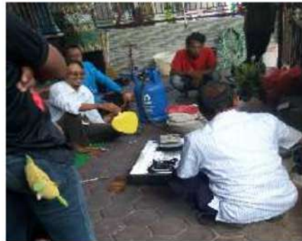
Gambar 4. Persiapan Alat dan Bahan Pengecoran Ulang Aluminium

Pola yang disediakan masih sederhana dengan harapan akan bisa memancing kreasi dari pada peserta untuk dapat membuat dan mendesain sendiri pola pilihan sesuai dengan kreasi dari masing-masing peserta. Untuk tahap awal pola yang di pilihkan berupa sebuah gantungan kunci sederhana yang bertuliskan "Madiun", seperti pada gambar 5.