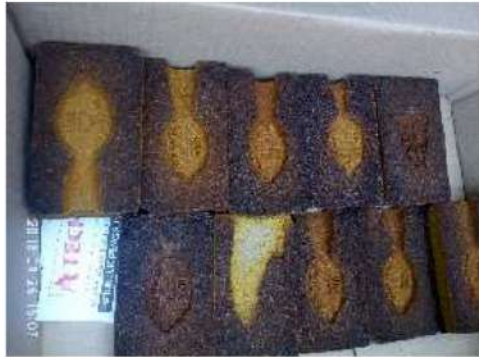
Gambar 5 Hasil pembuatan pola cetakan

Sesi kedua adalah praktek pengecoran dari masing masing peserta, seperti terdokumentasi dalam Gambar 6 dan 7.