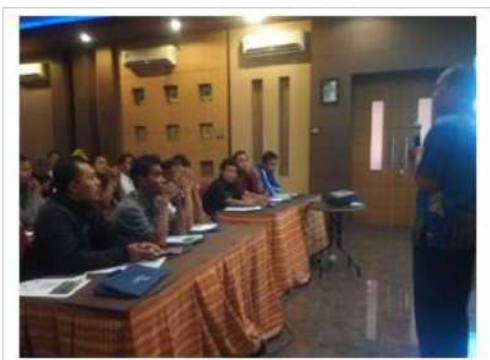
Gambar 2. Pemberian Teori kepada Peserta Pelatihan mengenai Logam dan Pengecoran Aluminium