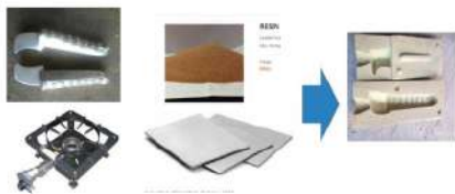
Gambar 3. Alat dan Bahan untuk Pembuatan Cetakan Pasir

Dalam pelaksanaan kegiatan praktik agar waktunya efektif dan efisien, dibagi menjadi 2 yaitu persiapan dan pelaksanaan praktik baik secara umum maupun perorangan dari masing-masing peserta. Diawali dengan penyiapan alat dan bahan-bahan antara lain LPG, blower , kompor gas, burner , pelat besi, tang panjang, sarung tangan kulit, tempat peleburan, master pola. Alat dan bahan seperti pada gambar 3, sedangkan alat dan bahan untuk proses pengecoran adalah tampak pada gambar 4 berikut ini.