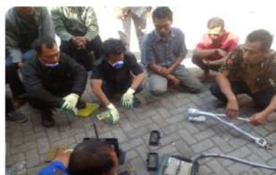
Gambar 5 Praktik Pembuatan Pola dan Pengecoran Aluminium oleh Peserta Didampingi Pemateri .

Pertama pemateri memberikan teori praktis sekaligus praktik untuk penjelasan dan pembuatan cetakan dari pasir resin. Selanjutnya peserta mempraktikkan pembuatan pola dari pasir resin, sehingga masing-masing peserta bisa berdiskusi dengan pemateri seandainya ada kesulitan atau pertanyaan tentang pembuatan cetakan pasir ini.