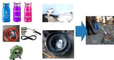
Gambar 4. Alat dan Bahan untuk Proses Pengecoran Sederhana

Pertama pemateri memberikan teori praktis sekaligus praktik untuk penjelasan dan pembuatan cetakan dari pasir resin. Selanjutnya peserta mempraktikkan pembuatan pola dari pasir resin, sehingga masing-masing peserta bisa berdiskusi dengan pemateri seandainya ada kesulitan atau pertanyaan tentang pembuatan cetakan pasir ini.