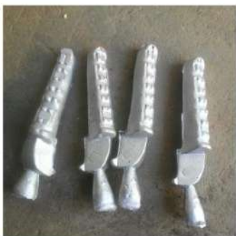
Gambar 6. Hasil Pengecoran Aluminium

yang sederhana diharapkan bisa memunculkan ide kreatif peserta untuk dapat membuat dan mendesain sendiri pola dari spare part lainnya.