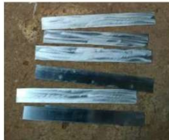
Gambar 3. Pengenalan material jenis spring steel / food grade material

Dalam pelaksanaan kegiatan praktik ini diawali dengan pengenalan material baru yang digunakan untuk produk pande besi dengan kualitas yang lebih baik dengan mengutamakan kecepatan produksi dengan waktu pengerjaan yang terbatas. Hal ini akan sangat membantu para pande besi bilamana mendapatkan pesanan dalam jumlah besar tetapi dengan waktu singkat. Hal ini bisa dilakukan karena material yang di gunakan hanya membutuhkan sedikit perlakuan pada bagian tertentu saja , tidak seperti proses pande besi yang keseluruhan membutuhkan proses dalam pembentukannya. Jenis Material tersebut seperti tampak pada gambar 3 berikut ini.