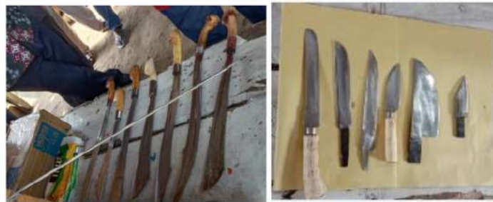
Gambar 5. Hasil Kegiatan Pande besi

Dari kegiatan pengabdian yang dilakukan , melalui pengenalan material spring steel food grade material dan perlakuan panas dengan pendinginan menggunakan air garam akan menghasilkan kualitas yang lebih baik , dengan waktu yang lebih cepat untuk penyelesaiannya. Sedangkan untuk penggunaan air garam ada beberapa syarat tertentu dari spesifikasi material yang di gunakan . Untuk hasil akhir dari kegiatan ini bisa di dokumentasikan seperti pada gambar 5.