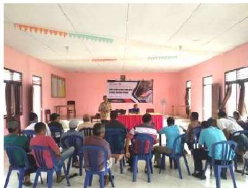
Gambar 2. Tim Pengabdian Masyarakat Memberikan Materi mengenai karakteristik Logam dan Perlakuan panas pada logam