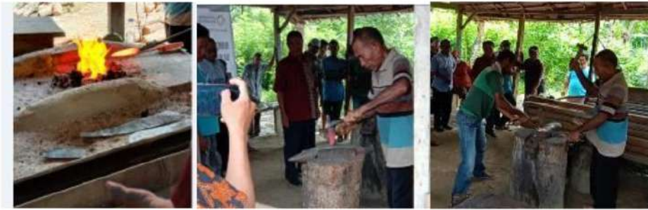
Gambar 4. Praktik Perlakuan panas

Dari kegiatan pengabdian yang dilakukan , melalui pengenalan material spring steel food grade material dan perlakuan panas dengan pendinginan menggunakan air garam akan menghasilkan kualitas yang lebih baik , dengan waktu yang lebih cepat untuk penyelesaiannya. Sedangkan untuk penggunaan air garam ada beberapa syarat tertentu dari spesifikasi material yang di gunakan . Untuk hasil akhir dari kegiatan ini bisa di dokumentasikan seperti pada gambar 5.