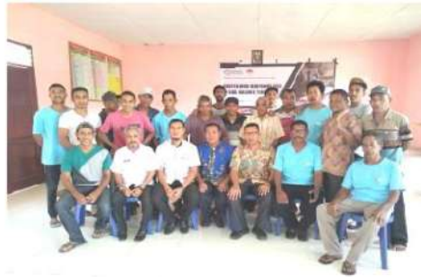
Gambar 1. Peserta Pelatihan bersama Tim Pengabdian Masyarakat

Adapun pelaksanaan teori dari kegiatan Pengabdian kepada Masyarakat ini terdokumentasi pada Gambar 1 dan 2 dibawah ini.