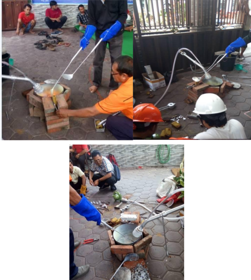
Gambar 4. Kegiatan praktik pengecoran yang dilakukan peserta dengan di didampingi oleh tim pengabdian masyarakat

burner. Untuk dokumentasi pada saat peserta melakukan kegiatan praktik 2 ditunjukkan pada gambar 4 di bawah ini