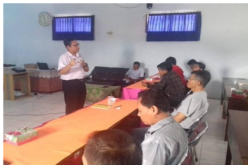
Gambar 2. Kegiatan berupa pemberian materi tentang karakteristik aluminium

Materi yang di berikan berupa karakteristik logam khususnya aluminium, di berikan dengan tujuan agar peserta mempunyai pemahaman dan pengetahuan yang sama tentang aluminium yang nantinya menjadi bahan utama untuk kegiatan daur ulang ini. Dilanjutkan dengan materi mengenai dasar dasar pengecoran aluminiu. Dokumentasi kegiatan pemberian materi di sajikan dalam gambar 2 di bawah ini.