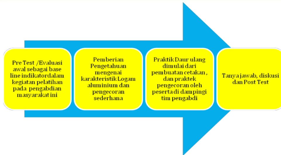
Gambar 1. Tahap pelaksanaan Pelatihan daur ulang sampah aluminium

Pada gambar 1 disajikan tahap pelaksanaan kegiatan pengabdian kepada masyarakat. Tahapannya yaitu: