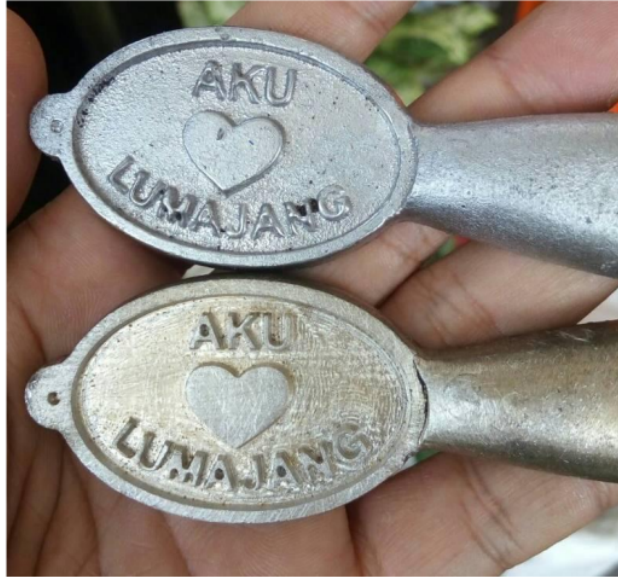
Gambar 5. Hasil pengecoran logam sederhana

Evaluasi kegiatan dilakukan dalam bentuk post test ,tetapi evaluasi proses dilakukan dengan tanya jawab serta diskusi yang bisa di jadikan indikator mengenai pemahaman para peserta dalam mengikuti kegiatan ini