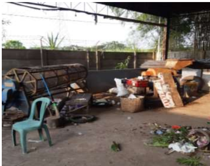
Gambar 7. Pilot Project Pengolahan Sampah Organik

Kondisi eksisting TPS 3R di lingkungan Kresek desa Tempurejo juga telah menjalankan pilot project pengelolaan sampah organik menjadi kompos dalam skala kecil. Hal ini pula yang menjadi bahan sosialisasi tim pengabdian masyarakat ITN Malang melalui banner, pamflet dan selebaran yang dibagikan kepada masyarakat desa setempat, yaitu berupa contoh hasil pemilahan sampah yang telah daur ulang dan bernilai ekonomis lebih tinggi sehingga dapat meningkatkan kesejahteraan keluarga. Pendampingan kegiatan pengelolaan sampah bernilai ekonomis lebih tinggi akan menjadi sasaran lanjutan dalam kegiatan pengabdian masyarakat setelah kesadaran masyarakat di lingkungan Kresek desa Tempurejo terhadap konsep 3R semakin meningkat dengan partisipasi aktif.