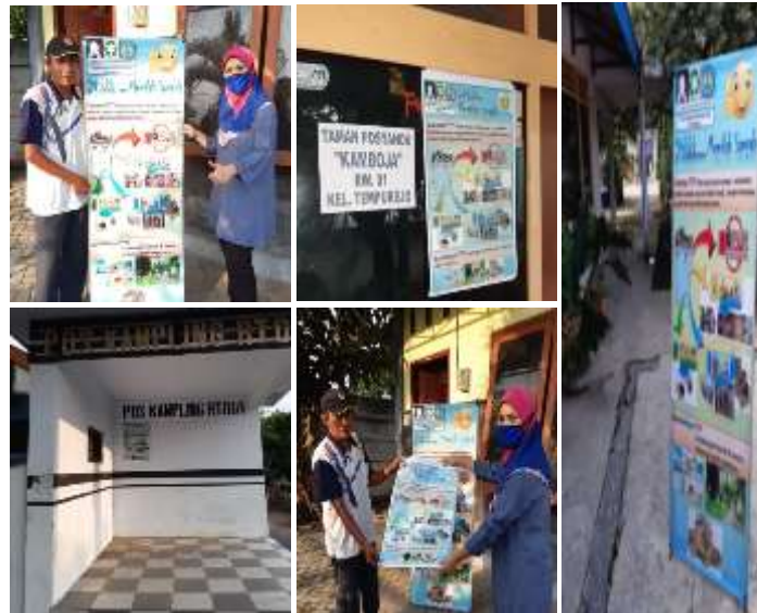
Gambar 5. Kegiatan Sosialisasi Pengelolaan Sampah

selama pandemi sehingga tetap dapat memperoleh pengetahuan tambahan tentang pengelolaan sampah rumah tangga. Melalui selebaran, banner dan pamflet yang dibagikan, diharapkan seluruh warga di lingkungan Kresek dapat membaca ajakan untuk berpartisipasi dalam pengelolaan sampah rumah tangga dan tergerak untuk berperan aktif.