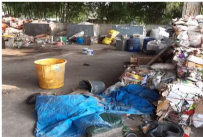
Gambar 4. Fasilitas Pemilahan Sampah di TPS 3R Lingkungan Kresek

TPS 3R di lingkungan Kresek sebenarnya telah memberi contoh pengelolaan sampah rumah tangga yang dihasilkan oleh warga, yaitu dengan penyediaan fasilitas pemilahan jenis-jenis sampah serta bantuan petugas pemilah dari Dinas Kebersihan dan Pertamanan Kota Kediri.