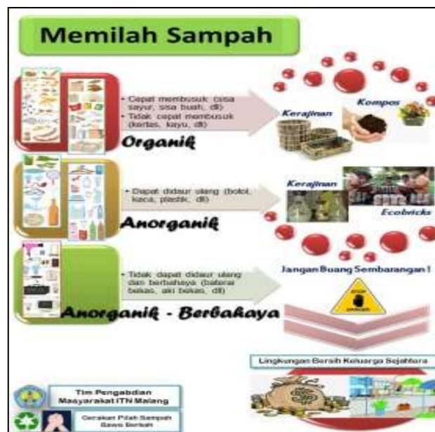
Gambar 6. Selebaran Pengelolaan Sampah