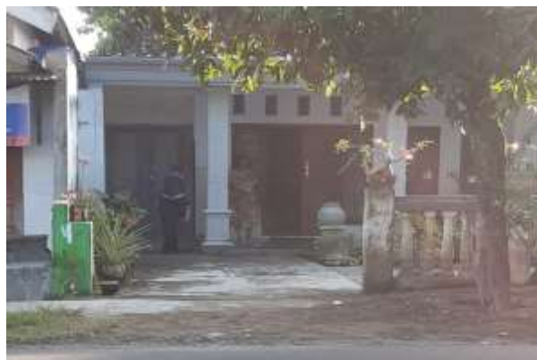
Gambar 3. Proses Penyebaran Kuisioner Partisipasi Masyarakat

Berkaitan dengan terjadinya pandemi covid, wilayah lingkungan Kresek desa Tempurejo termasuk dalam zona merah kota Kediri dengan adanya beberapa warga sebagai pasien dalam pengawasan dan menjalani prosedur isolasi di rumah sakit maupun isolasi mandiri, sehingga penyebaran kuisioner partisipasi masyarakat menjadi terkendala, namun masih dapat dilaksanakan dengan jumlah sebaran yang terbatas dengan dibantu oleh pengurus RW setempat. Wawancara secara lebih mendalam dilaksanakan bersama dengan pengurus TPS dan RW untuk mengurangi penyimpangan hasil pada keterbatasan penyebaran kuisioner.