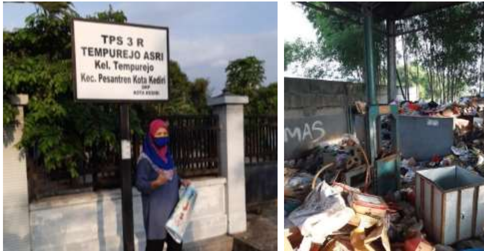
Gambar 2. TPS 3R Lingkungan Kresek Desa Tempurejo

buang, sehingga tujuan utama pengelolaan sampah berbasis “3R” ( reuse, reduce, recycle ) belum maksimal akibat kurangnya sinergi yang seharusnya terbangun antara TPS dan partisipasi masyarakat. Proses pemilahan dilakukan di TPS dengan dibantu tenaga dari Dinas Kebersihan dan Pertamanan Kota Kediri dan mulai mengolah kembali sampah organik menjadi kompos.