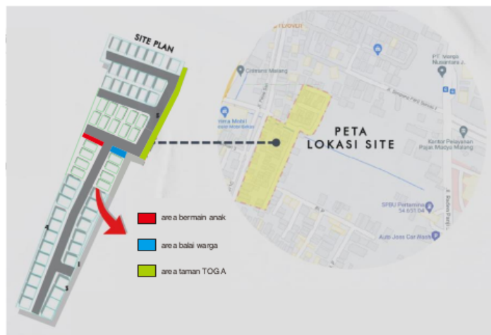
Tata Letak Rencana Fasos Perumahan PP

Solusi dari kurangnya ruang sosialisasi antar warga adalah dengan mendesain bangunan balai warga yang terintegrasi dengan pos satpam, mendesain taman TOGA dan mendesain taman bermain anak. Solusi dari pengawasan ekstra untuk penghuni dan tamu luar adalah dengan mendesain bangunan pos satpam utama yang terintegrasi dengan balai warga.