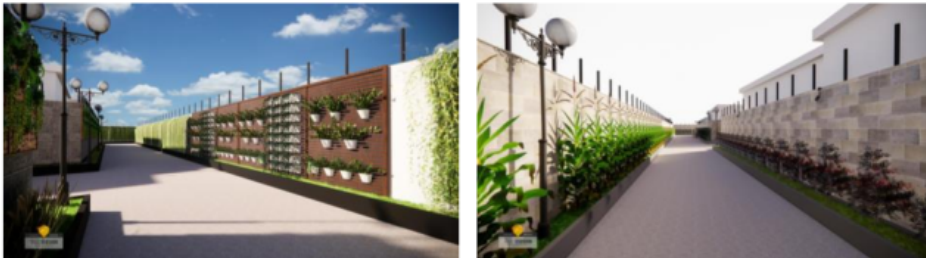
Gambar 4. Alternatif Desain Taman TOGA (Alt 1-kiri) TOGA + tanaman hias, (Alt 2-kanan) TOGA + tanaman buah

Aktivitas yang akan muncul jika taman TOGA terwujud adalah: (1) aktivitas rekreatif sosial, (2) aktivitas rekreatif ekologi dan (3) area resapan air tanah. Dengan adanya area TOGA, ibu rumah tangga memiliki aktivitas tambahan pada sore dan pagi hari. TOGA membantu menyediakan stok segar bumbu dapur (elemen hijau) dan area mengajak anak jalan-jalan (rekreatif sosial) dan mengurangi limpahan air pada saat hujan.