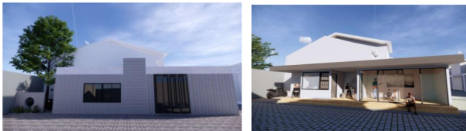
Gambar 2. Alternatif Desain Balai Warga + Pos Satpam Utama (Alt 1-kiri) minimalis, (Alt 2-kanan) modern

Aktivitas yang akan muncul dengan perwujudan bangunan adalah: (1) aktivitas berkumpul, (2) aktivitas imunisasi dan (3) aktivitas pemantauan. Ketiga aktivitas tersebut adalah aktivitas inti pada bangunan balai warga. Aktivitas berkumpul terkait dengan kebutuhan ruang balai warga dengan subyek bapak kepala rumah tangga dan perangkat pagayuban perumahan PP. Aktivitas imunisasi terkait dengan kebutuhan ruang imunisasi (terintegrasi dengan ruang balai warga) dengan subyek ibu rumah tangga dan petugas kesehatan. Aktivitas pemantauan terkait dengan ruang CCTV terpadu—antara pos satpam 1 (depan) dengan pos satpam 2 (tengah). Ruang toilet disediakan untuk semua pengguna bangunan tersebut dan juga dapat digunakan untuk umum jika dalam keadaan mendesak.