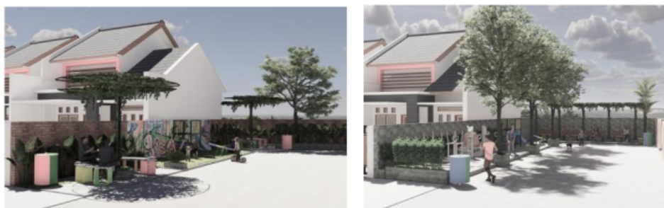
Gambar 6. Alternatif Desain Taman Bermain Anak (Alt 1-kiri) tipe pegola, (Alt 2-kanan) tipe permainan aktif

Aktivitas yang akan muncul jika taman TOGA terwujud adalah: (1) aktivitas berkumpul warga, (2) aktivitas bermain anak dan (3) aktivitas sosialisasi. Ketiga aktivitas terkait satu sama lainnya yaitu bersosialisasi antara bapak rumah tangga, ibu rumah tangga dan anak warga perumahan PP.