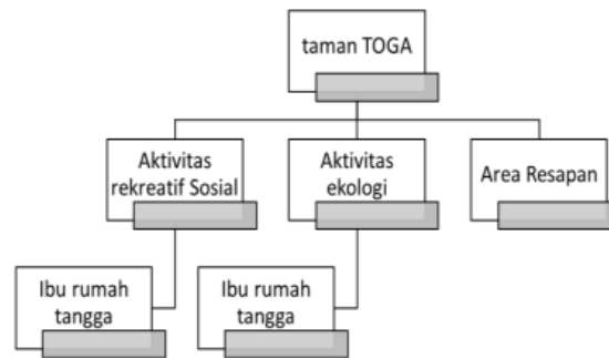
Gambar 3. Diagram aktivitas taman TOGA

Perancangan taman TOGA diharapkan dapat mengatasi masalah sosial internal. Masalah sosial internal terkait dengan kurangnya fasilitas sosialisasi ibu rumah tangga perumahan PP, kurangnya elemen hijau, kurangnya area resapan air hujan. Menyikapi area sisa pada sisi jalan maka dipergunakan untuk menanam tanaman obat keluarga (TOGA).