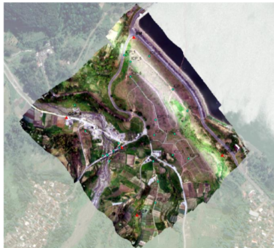
Gambar 5. Overlay Orthophoto dengan Basemap (Googlemaps Satellite)

Hasil orthophoto selanjutnya dioverlay dengan Citra Googlemaps Satellite. selain digunakan sebagai basemap overlay tersebut bertujuan untuk melihat