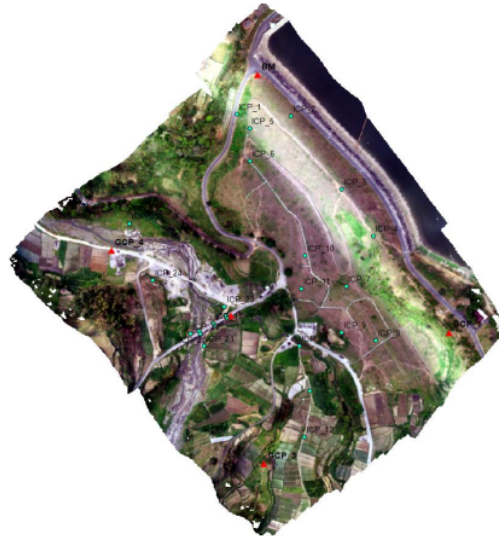
Gambar 4. Orthophoto Kawasan Waduk

Tahapan pengolahan data foto dilakukan dengan software Agisoft Metashape untuk mendapatkan orthophoto dan DEM, yang mana nantinya data orthophoto digunakan sebagai dasar untuk mendapatkan data tutupan lahan yang diolah dengan software ArcGis 10.8 dan data DEM digunakan untuk mendapatkan data kelerengan dengan proses sebelumnya dihaluskan dengan menggunakan software SAGA GIS untuk menghilangkan objek yang ada pada permukaan DEM. Hasil orthophoto ditunjukkan oleh gambar 4 dari pengolahan data foto, yang nantinya hasil tersebut akan digunakan untuk rencana pembuatan peta rawan longsor.