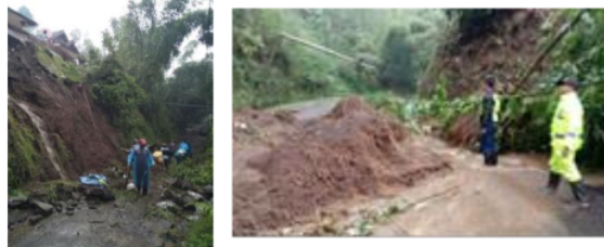
Gambar 1. Longsor di Kecamatan Ngantang

Sebagai bentuk dari pengabdian kepada masyarakat maka akan dilaksanakan suatu identifikasi resiko rawan bencana tanah longsor di Desa Pandanasari Kabupaten Malang dengan metode Sistem Informasi Geografis dengan memanfaatkan data hasil pemotretan udara berupa ortofoto dan DEM. DEM merupakan model permukaan digital yang menyajikan data berupa ketinggian permukaan tanah untuk identifikasi tingkat kelereangan suatu wilayah. Ortofoto merupakan data yang terkoreksi secara geometris untuk menggambarkan kenampakan permukaan objek serta menganalisis penggunaan lahan. Pembuatan model orthophoto bertujuan untuk dapat melihat daerah yang direkam secara keseluruhan baik dari foto asli maupun foto yang telah direktifikasi (Subaryono et al. , 2008). Pada proses identifikasi dapat memanfaatkan parameter data yang diperlukan sebagai pendukung proses identifikasi bencana tanah longsor (Azeriansyah et al. , 2017). Pihak pemerintah desa melalui program abdimas ini bekerja sama dalam mencari solusi permasalahan dan diharapkan hasil dari program penelitian ini nantinya dapat bermanfaat bagi masyarakat khususnya Desa Pandanasari, Kecamatan Ngantang, Kabupaten Malang untuk mengetahui tingkat kerawanan longsor dari kelas rendah hingga sangat rawan, agar masyarakat mampu menanggulangi dan mengantisipasi terjadinya longsor.