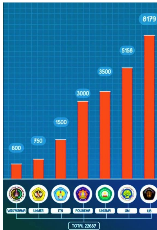
Gambar 1. 1 Data Peningkatan Mahasiswa di Kota Malang

Menurut data perguruan tinggi di Kota Malang tercatat kurang lebih 85 perguruan tinggi baik negeri maupun swasta. Perguruan tinggi tersebut diantaranya ada :