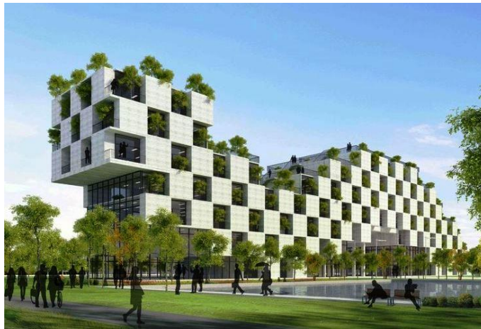
Gambar 1. 2 Bangunan arsitektur hijau

Arsitektur Hijau (Green Architecture) bertujuan untuk menciptakan lingkungan hidup yang lebih baik dan lebih sehat dengan meminimalisir dampak negatif terhadap lingkungan alam dan manusia, dicapai melalui penggunaan energi dan sumber daya alam yang efisien dan optimal. dapat didefinisikan sebagai konsep arsitektur. Konsep bangunan hijau lebih hijau, lebih harmonis antara struktur dan lingkungan, dan menggunakan sistem utilitas yang lebih baik. Arsitektur hijau dianggap sebagai desain yang baik dan bertanggung jawab dan harus digunakan sekarang dan di masa depan.