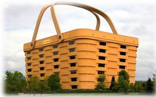
Gambar 1.2 Arsitektur Metafora

Tema dalam perancangan ini mengambil tema Arsitektur Metafora. Sejarah munculnya Arsitektur Metafora yaitu tema ini muncul di era postmodern sebagai ungkapan visual yang dapat memunculkan sebuah pesan.