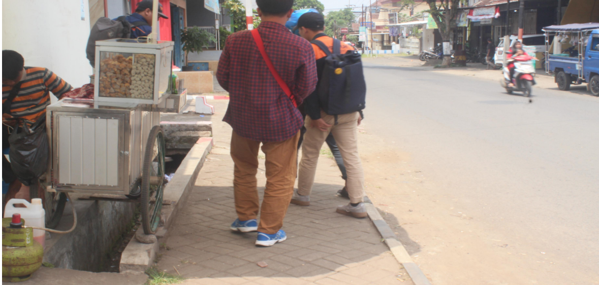
LAMPIRAN 1. Kegiatan Survey lokasi untuk perancangan pasar tradisional