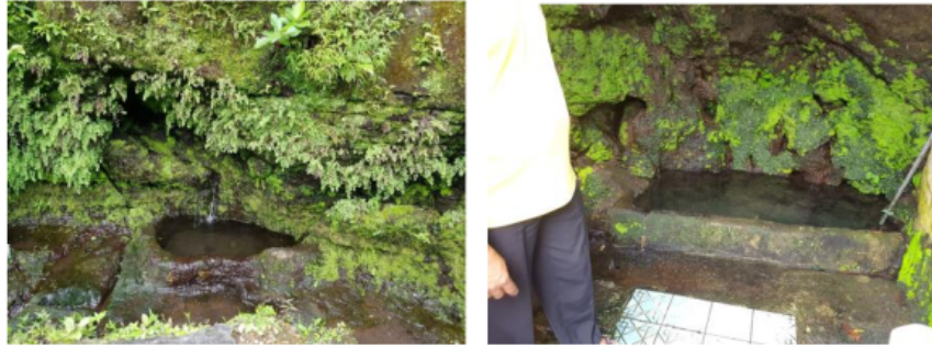
Gambar 2. Kondisi beberapa sumber mata air di lokasi

Pada lokasi tapak memiliki potensi atau keistimewaan yang berupa adanya beberapa sumber mata air, yang selama ini dimanfaatkan warga sekitar untuk kebutuhan sehari-hari, tanpa adanya upaya untuk mempertimbangkan upaya untuk konservasi.