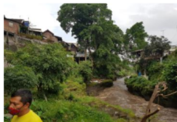
Gambar 3. Kondisi Sempadan Sungai

Kondisi lahan miring yang berada di sekitar DAS dan sumber mata air, sangat rawan longsor dan memiliki tingkat kesulitan tersendiri untuk dilalui pejalan kaki terutama pada musim hujan.