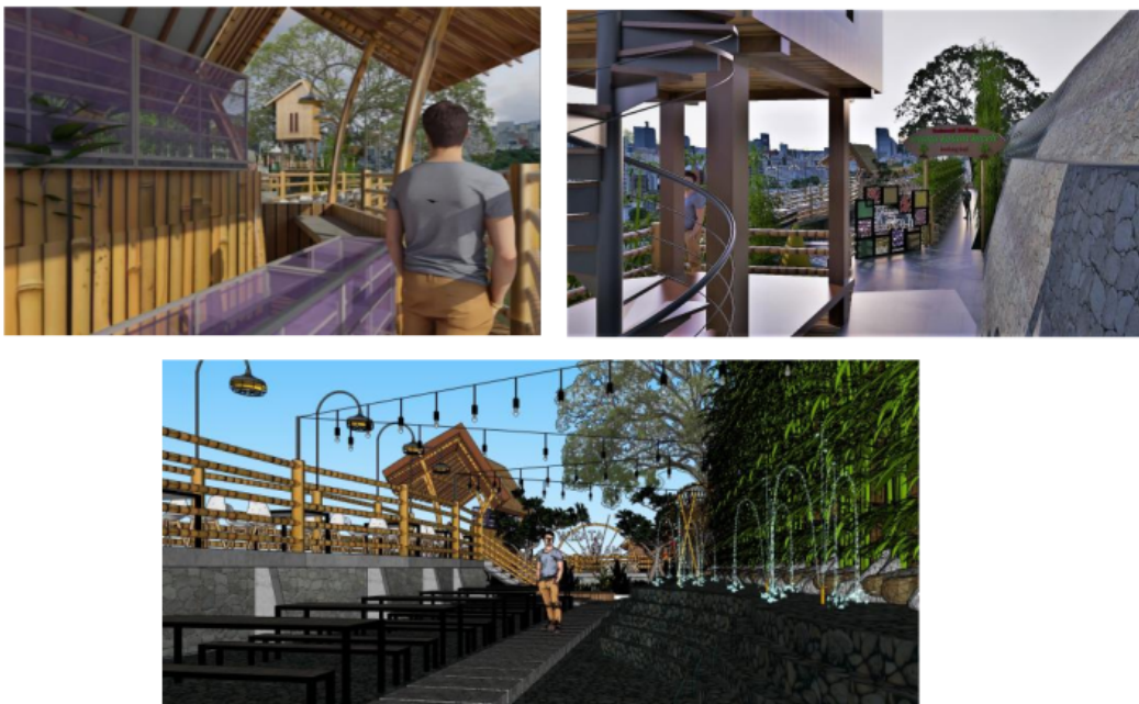
Gambar 5. Pemanfaatan Lahan Miring untuk Area Wisata

Peningkatan fasilitas yang ada berupa fasilitas komersil sehingga dapat membawa manfaat bagi kesejahteraan masyarakat sekitar dan juga pemasukan bagi pemerintah setempat. Upaya tersebut juga dapat mendukung program Pemerintah Kota Malang yang berusaha mendongkrak sektor pariwisata, terutama di masa pasca pandemi. Selain sektor pariwisata, usaha mikro masyarakat sekitar juga diharapkan akan semakin berkembang.