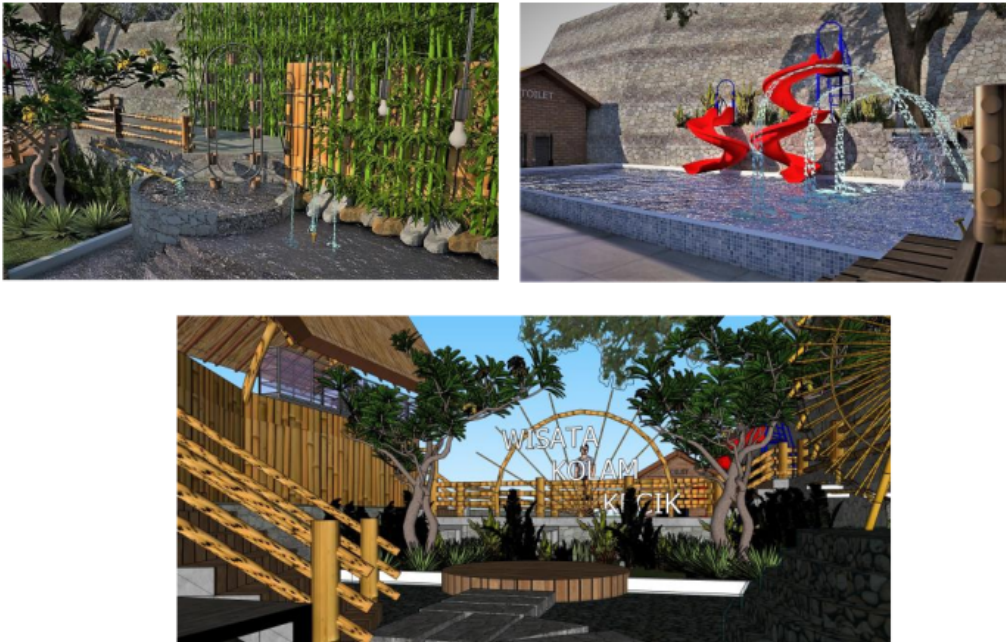
Gambar 6. Desain Konservasi Sumber Mata Air

Konsep yang dibutuhkan untuk upaya konservasi sumber mata air adalah desain pemanfaatan dengan memberikan perlindungan terhadap sumber air agar tidak langsung dapat diakses oleh masyarakat. Sehingga dengan desain tersebut diharapkan mampu menjaga kualitas dan kuantitas ketersediaan air.