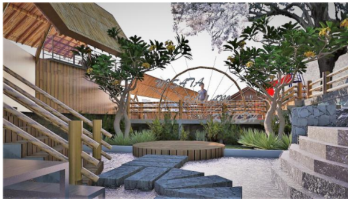
Gambar 4. Pengolahan Area Sirkulasi pada Lahan Miring

Dengan konsep desain jalur sirkulasi seperti pada gambar 4 diharapkan mudah dilalui warga sekitar sehingga mengurangi rasa enggan untuk pembersihan lokasi sumber mata air. Pembersihan area sekitar lokasi sumber mata air sangat diperlukan agar kualitas air tetap terjaga dengan baik. Sehingga diharapkan dapat juga dimanfaatkan oleh masyarakat yang mendiami permukiman di sekitar lokasi.