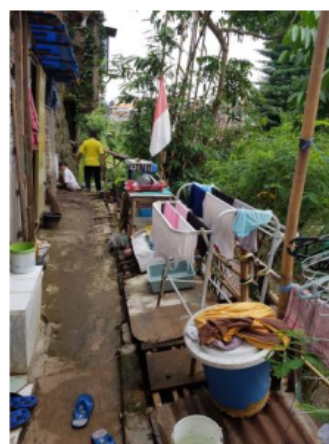
Gambar 1. Kondisi Eksisting Tapak PAWON: Jurnal Arsitektur, Nomor 01 Volume VII, Bulan Januari, Juni Tahun 2023, ISSN 2597-7636