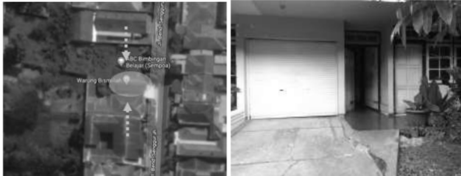
Gambar. 5 Site rumah kos dan perkerasan halaman

Penggunaan perkerasan pada rumah kos ini, tidak memberikan cukup ruang untuk resapan air hujan pada tapak bangunan. Kelemahan dari pemakaian perkerasan ini adalah perkerasan tersebut dapat memantulkan panas sehingga akan menambah suhu udara panas ke dalam bangunan.