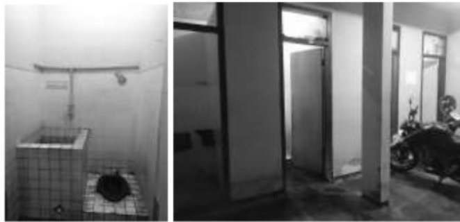
Gambar. 7 Kondisi kamar mandi rumah kos

Dari kondisi tersebut dapat dilihat, bahwa kondisi rumah kos yang dikaji ini memiliki system pencahayaan yang kurang dan aliran angin yang tidak maksimal pada tiap ruang dan terutama pada kamar mandi. Kondisi tersebut akan berdampak negative bagi kesehatan dan kenyamanan penghuni kos karena Green Architecture adalah suatu pendekatan perencanaan bangunan yang berusaha untuk meminimalisasi berbagai pengaruh membahayakan pada kesehatan manusia dan lingkungan.