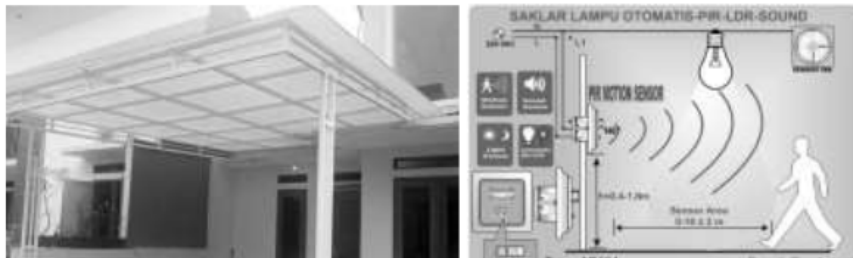
Gambar. 2 Penggunaan Twinlite Polycarbonate

Rumah kos tersebut sangat membutuhkan bantuan energi listrik yang artinya bangunan rumah kos tersebut tidak dan belum memanfaatkan cahaya sinar matahari dengan baik. Solusi dari pencahayaan tersebut adalah dengan mengganti material penutup void dengan material berbahan transparan yaitu twinlite Polycarbonate atau kaca. Namun dengan pertimbangan jika menggunakan bahan kaca, cahaya yang masuk kedalam ruangan lebih baik akan tetapi memiliki kekurangan yang sangat merugikan yaitu tidak dapat mengeluarkan radiasi panas dalam ruangan sehingga akan meningkatkan temperature ruangan.