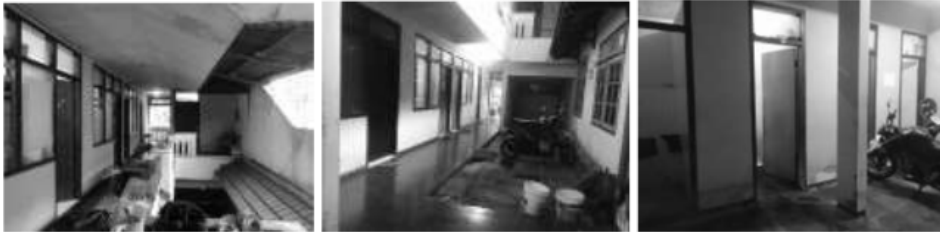
Gambar. 1 Eksisting pencahayaan pada rumah kos

sebisa mungkin memaksimalkan energi alam sekitar lokasi bangunan. Hal tersebut dapat dilakukan dengan pemanfaatan posisi jatuhnya sinar matahari terhadap bangunan, sehingga hal tersebut mampu mengurangi penggunaan energi listrik dan memanfaatkan secara maksimal sinar matahari yang masuk menerangi ruangan.