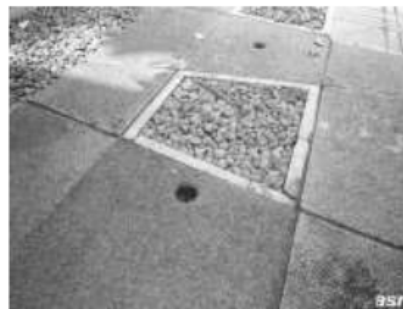
Gambar. 6 Solusi resapan air hujan

Respect for site dalam hal ini dapat dilakukan dengan cara menyediakan ruang resapan pada tapak dan mengganti material perkerasan yang ada dengan bahan yang dapat menyerap air dan tidak memantulkan panas matahari, sehingga akan membantu jumlah ruang terbuka hijau pada perkotaan yaitu dengan menyumbangkan lahan bangunan rumah kos untuk ruang terbuka hijau sebanyak 20%.