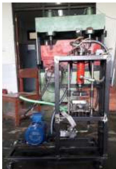
Fig. 1. Prototype.