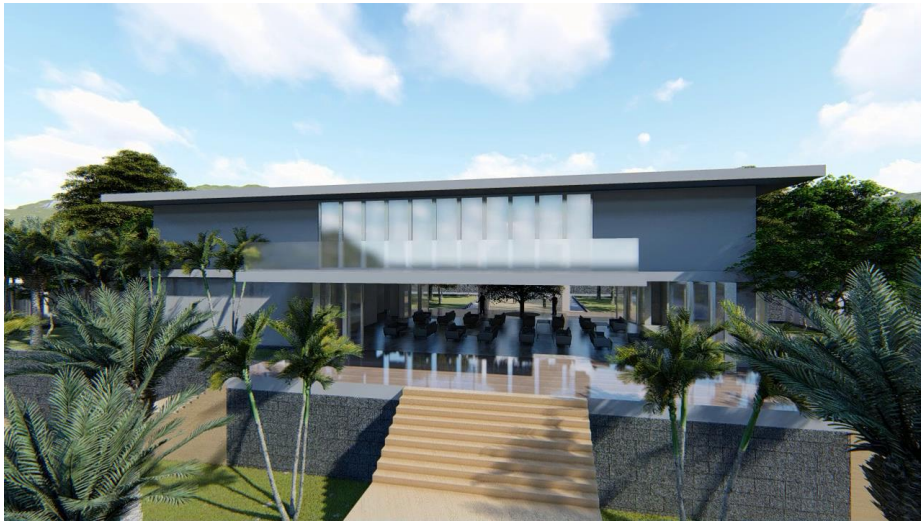
Gambar 6 Perspektif Restaurant & Office