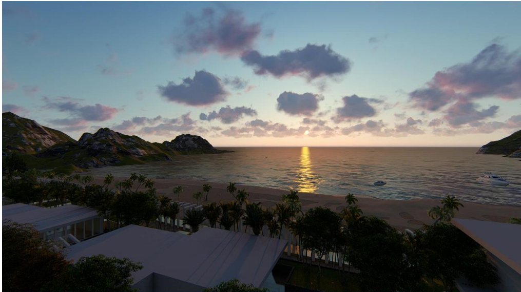
Gambar 8 Situasi & Suasana