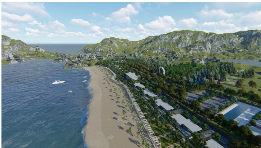
Gambar 3 Perspektif Tapak Utama