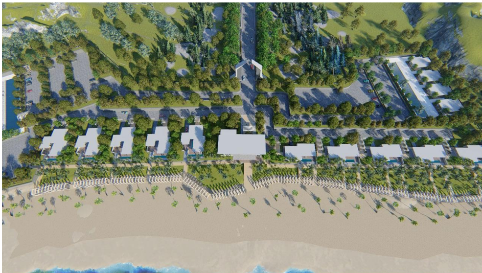
Gambar 2 Perspektif Tapak Utama