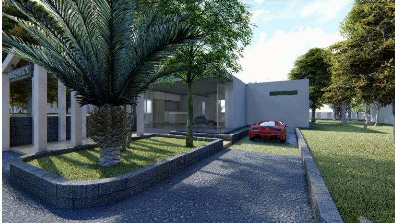
Gambar 4 Exterior Villa

Terdapat beberapa tipe massa bangunan pada vila mansion ini, antara lain: