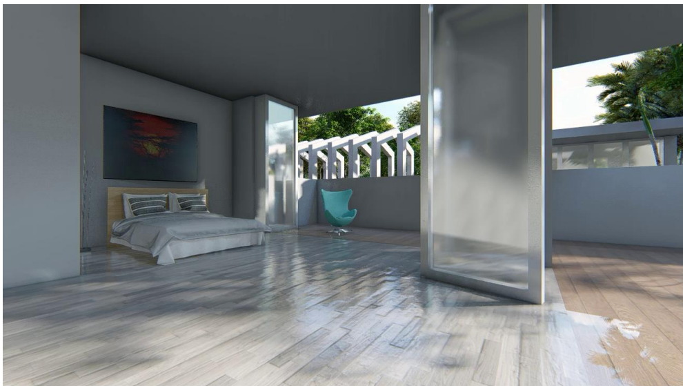
Gambar 5 Interior Villa