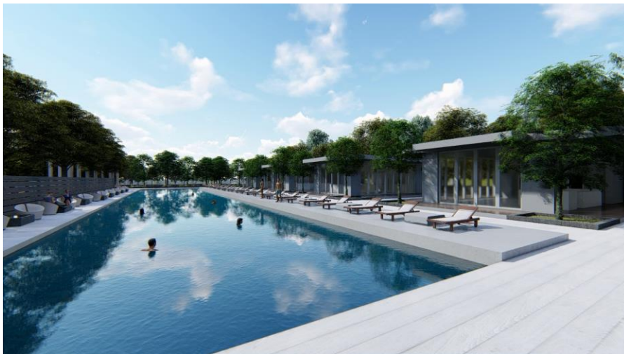
Gambar 7 Perspektif Bar & Lounge