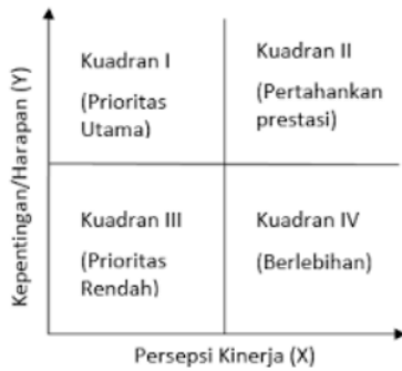
Gambar 2. Analisis Kuadran IPA

Analisi IPA dilakukan dengan tujuan untuk pengukuran terhadap hubungan persepsi dengan peningkatan sebuah kualitas akan produk atau jasa yang kemudian dimasukkan kedalam grafik yang dikenal dengan analisis kuadran. Hasil dari pengukuran terhadap metode ini akan ditampilkan dalam bentuk grafik yang terbagi atas empat bagian, dimana garis X sebagai performance dan garis Y sebagai importance .