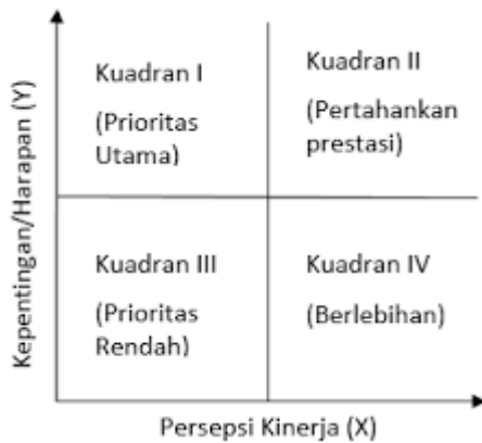
Gambar 2. Analisis Kuadran IPA

Analisis IPA dilakukan dengan tujuan untuk pengukuran terhadap hubungan persepsi dengan peningkatan sebuah kualitas akan produk atau jasa yang kemudian dimasukkan kedalam grafik yang dikenal dengan analisis kuadran. Hasil dari pengukuran terhadap metode ini akan ditampilkan dalam bentuk grafik yang terbagi atas empat bagian, dimana garis X sebagai performance dan garis Y sebagai importance .