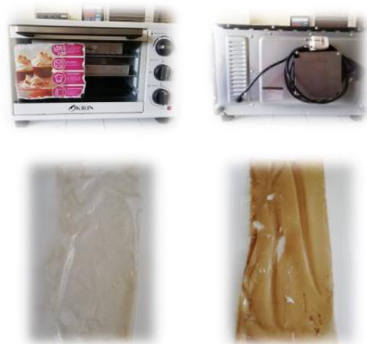
Gambar 4. Mesin dehydrator dan bioplastik yang telah kering

Bioplastik yang masih cair diletakkan dalam wadah datar dan dikeringkan dengan mesin dehydrator.