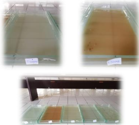
Gambar 3. Bioplastik kondisi basah

Berikut ini merupakan proses dasar pembuatan bioplastik sebelum dibentuk menjadi tempat makanan dan minuman.