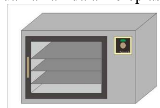
Gambar 2. Mesin dehydrator

Mesin dehydrator yang dibuat digunakan untuk mengeringkan bioplastik. Alat ini dapat bekerja pada suhu rendah dimana dapat mengeluarkan air dalam bioplastik.