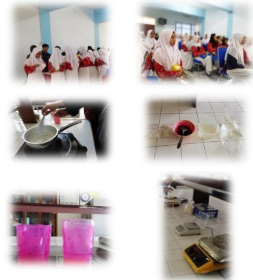
Gambar 5. Pelatihan Bioplastik di SMA Nasional Malang

Berikut adalah kegiatan pelatihan di SMA Nasional: