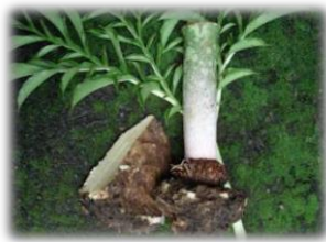
Gambar 1. Umbi Suweg

Telah banyak dilakukan penelitian pembuatan plastik yang mudah terurai ( biodegradable ), beberapa diantaranya adalah berbahan dasar pati dari umbi suweg, serat tebu, yang ditambahkan chitosan sebagai filler dan plastizicer berupa gliserol [11,12,13,14,15]. Pembuatan plastik menggunakan bahan alami yang dapat diperbaharui dengan menggunakan umbi suweg sebagai sumber pati dapat dilakukan karena adanya komponen amilosa dan amilopektin, serta ampas tebu sebagai sumber selulosa dimana sifat selulosa dapat menjadikan suatu produk memiliki tensile strength yang tinggi [16,17,18]. Berikut adalah gambar dari umbi suweg: