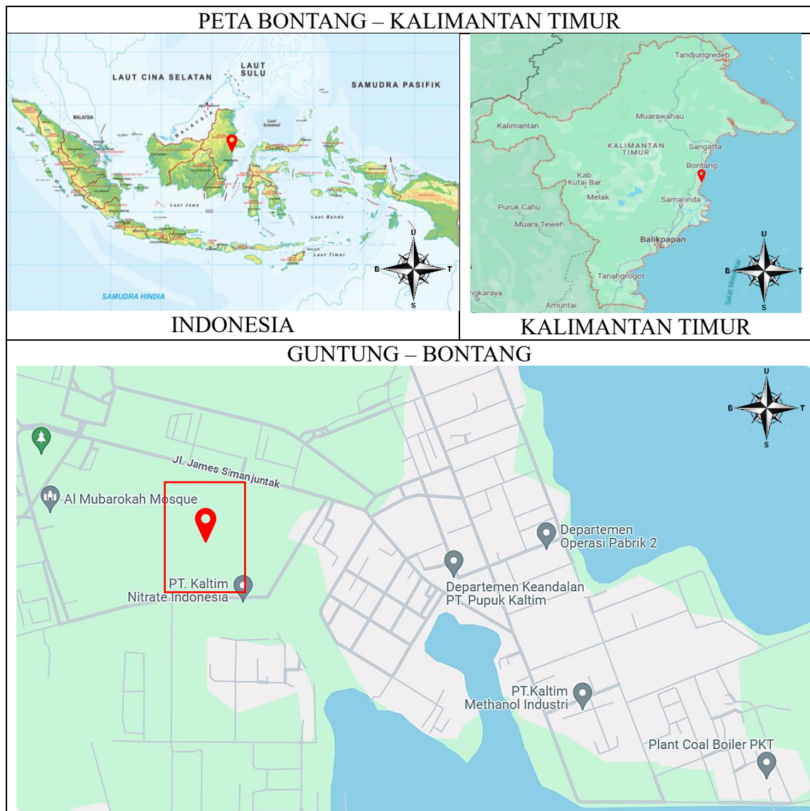
Gambar 1.1. Peta Lokasi Pendirian Pabrik Dimetil Eter

Berdasarkan pertimbangan di atas dapat disimpulkan bahwa kawasan Bontang cocok untuk dijadikan lokasi pabrik dimetil eter di Indonesia.