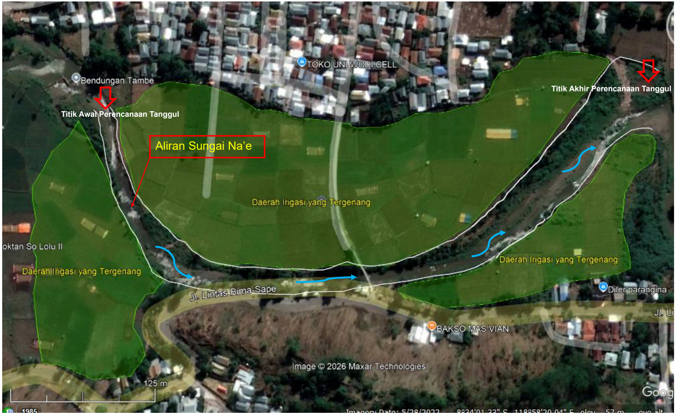
Gambar 1. 2 Peta Aliran Sungai Na'e