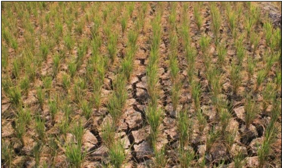
Gambar 1.1. Kondisi lahan pertanian kekurangan suplai air irigasi

Kota Pasuruan merupakan daerah yang mengalami perkembangan kota yang sangat pesat. Salah satu aspeknya adalah kawasan perumahan, dimana hampir di seluruh sudut Kota Pasuruan sedang bermunculan kawasan perumahan baru baik itu di daerah perbatasan kota maupun di daerah pertanian. Luas areal sawah atau pertanian terus berkurang akibat alih fungsi lahan. Dampak yang terjadi adalah kekurangan suplai air irigasi di beberapa tempat yang mengakibatkan lahan pertanian tidak bisa produksi maksimal sehingga merugikan petani. Hal ini disebabkan karena saluran irigasi yang ada tidak mampu mengalirkan air irigasi sampai ke petak-petak irigasi yang membutuhkan seperti ditunjukkan pada Gambar 1.1 dibawah ini.