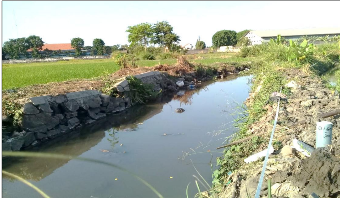
Gambar 1.2. Kerusakan konstruksi saluran irigasi menggunakan pasangan batu kali

tempat terjadi kebocoran karena longsoran tebing saluran dan penumpukan sedimen sebagaimana ditunjukkan pada Gambar 1.2.