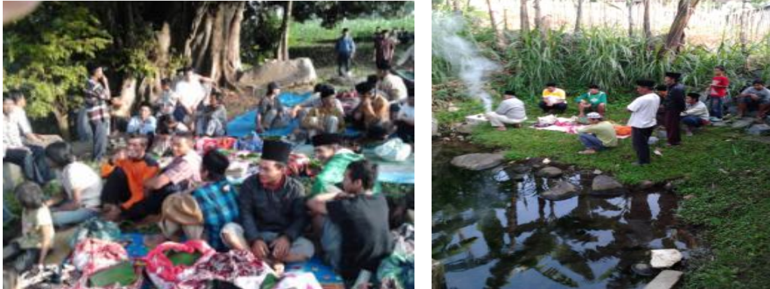
Sumber: Santosa, 2012

babat alas Desa Petungsewu, sehingga bisa dikatakan tempat ini awal atau (tempat) kelahiran. Mbelik merupakan sumber mata air yang menjaga kehidupan, sehingga bisa diartikan tempat ini sebagai pejaga-pemelihara. Kramat Rondo Kawak dan Rondo Kuning, yang menurut sejarahnya adalah merupakan istri-istri dari para pendiri desa, bisa diartikan sebagai pendamping dan penyelaras kehidupan, sedangkan kramat Mbah Toto adalah simbol kematian.