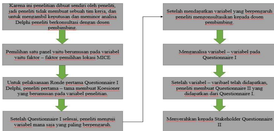
Gambar 1. Langkah – Langkah Peneliti Melakukan Teknik Delphi

Dasar – dasar dalam metode Delphi adalah bahwa latihan komunikasi group diantara ahli – ahli yang tersebar secara geografis (Adler dan Ziglio,1996). Metode ini membuat para ahli dapat menyepakati keputusan secara sistematis dengan permasalahan yang sangat kompleks. Esensi utama dari teknik ini hampir focus pada permasalahan. Metode ini menggunakan media questionnaire yang didesain agar dapat memunculkan atau mengembangkan respon individu terhadap sebuah permasalahan dan mereview pendapat dari beberapa pakar atau ahli mengenai permasalahan yang telah diterapkan. Pada dasarnya metode Delphi digunakan untuk menyelesaikan kekurangan dari aksi atau kegiatan komine yang konvensional, seperti pertemuan dan rapat – rapat menyulitkan.