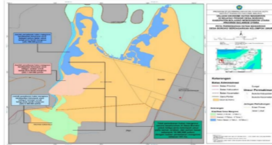
Gambar 1. Peta Persebaran Mangrove Berdasarkan Kelompok Umur

yang terjadi setiap 5 tahun sekali agar dapat diproduksi secara maksimal.