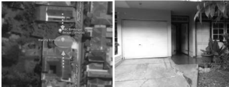
Gambar. 5 Site rumah kos dan perkerasan halaman

Penggunaan perkerasan pada rumah kos ini, tidak memberikan cukup ruang untuk resapan air hujan pada tapak bangunan. Kelemahan dari pemakaian perkerasan ini adalah perkerasan tersebut dapat memantulkan panas sehingga akan menambah suhu udara panas ke dalam bangunan.