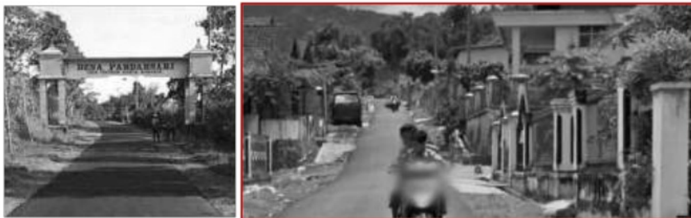
Gambar 2. Kondisi Desa Pandansari