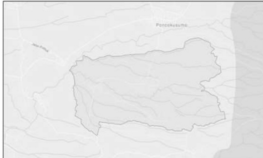
Gambar 1. Peta Desa Pandansari

sebagainya. Tak hanya itu, masyarakat desa juga membuat kerajinan home industri seperti kripik singkong, kripik talas, entong dan tusuk sate serta yang lainnya. Desa Pandansari disebut sebagai desa agropolitan memiliki pemandangan yang indah dan hawa yang sejuk.