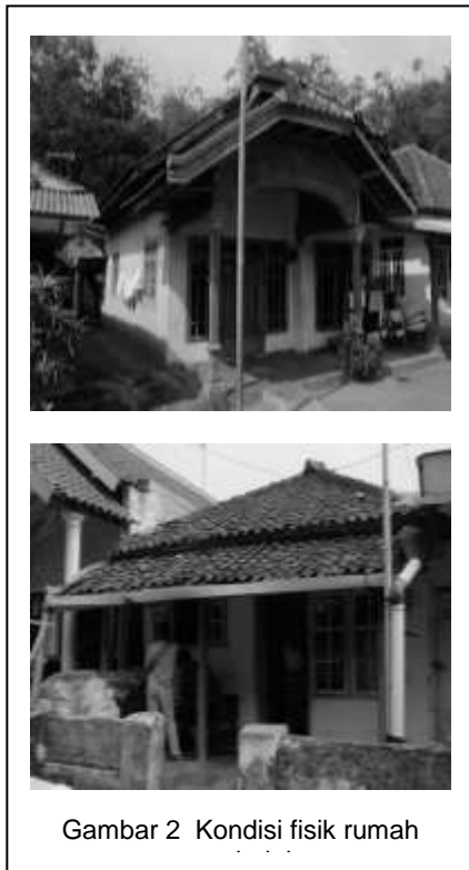
Gambar 2 Kondisi fisik rumah

Kondisi bangunan pada lokasi penelitian sebagian besar sudah bersifat permanen dengan menggunakan material dari bahan batu bata dan kayu. Sedangkan untuk bahan penutup lantai terbuat dari keramik dan plesteran semen. Sifat bahan akan sangat menentukan dalam terciptanya tingkat kenyamanan di dalam bangunan, kemampuan bahan dalam merespon kondisi lingkungan luar harus sesuai, apakah bahan tersebut dapat cepat melepas dan menyerap panas atau lambat dalam menyerap dan melepas panas, hal ini tergantung pada konstruksi dari bahan tersebut. Semakin tebal dan padat konstuksi suatu bahan, maka semakin lambat dalam merespon kondisi lingkungan. Dengan pemilihan material bangunan yang terbuat dari bahan permanen diharapkan mampu mempertahankan kondisi termal bangunan agar tidak mudah terpengaruh kondisi udara di luar rumah dengan temperatur udara yang lebih rendah dan kelembaban udara yang tinggi.