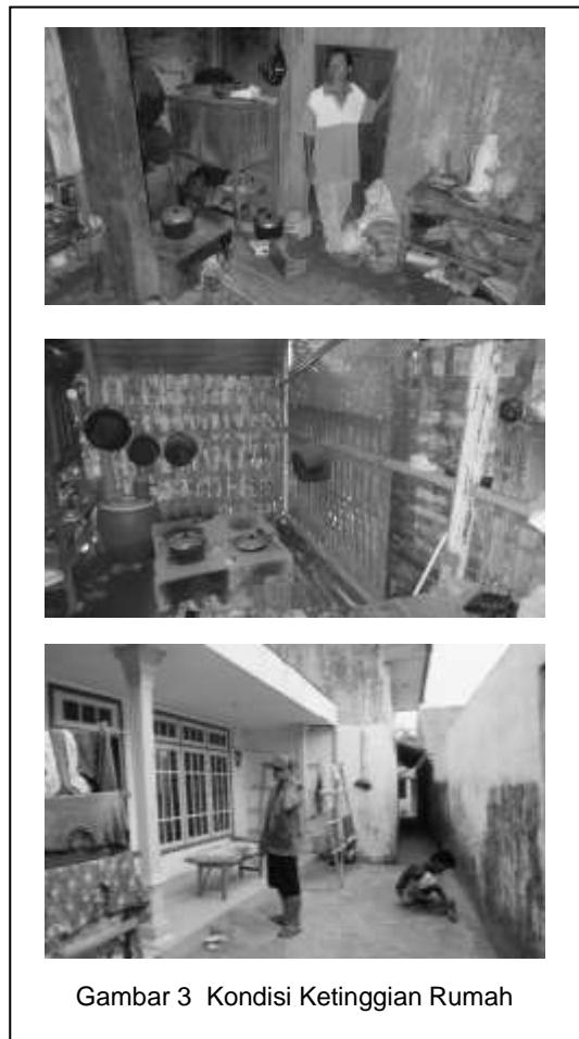
Gambar 3 Kondisi Ketinggian Rumah

Pada rumah-rumah di daerah Kecamatan Poncokusumo pada umumnya memiliki jarak antara lantai dengan plafond yang tidak terlalu tinggi, dengan ketinggian maksimal 3 m. Hanya sedikit rumah penduduk yang memiliki ketinggian jarak antara plafond dan lantai rumah yang lebih dari 3 m. Aktifitas para ibu di dalam ruangan dapur dengan rentang waktu yang cukup panjang, yaitu mulai bangun tidur pagi sampai dengan siang hari menyebabkan udara panas yang dihasilkan dari tungku di dapur terperangkap di dalam rumah sampai saat malam hari. Sensasi udara yang dihasilkan dari tungku dapur sebagai akibat dari kondisi itu membuat sensasi udara hangat di dalam rumah yang menjadikan kenyamanan termal di dalam rumah dapat dinikmati oleh seluruh anggota keluarga ketika saatnya mereka beraktifitas di dalam rumah.