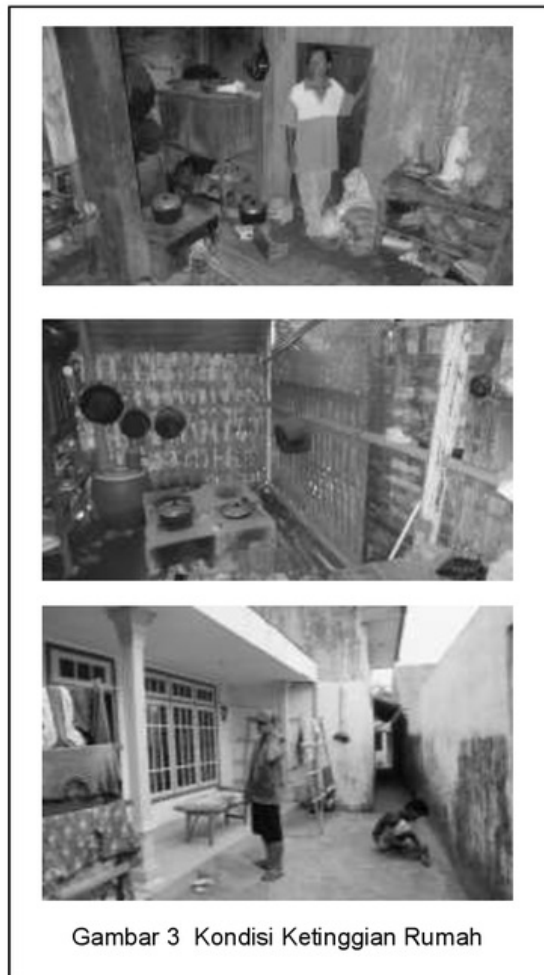
Gambar 3 Kondisi Ketinggian Rumah

Pada rumah-rumah di daerah Kecamatan Poncokusumo pada umumnya memiliki jarak antara lantai dengan plafond yang tidak terlalu tinggi, dengan ketinggian maksimal 3 m. Hanya sedikit rumah penduduk yang memiliki ketinggian jarak antara plafond dan lantai rumah yang lebih dari 3 m. Aktifitas para ibu di dalam ruangan dapur dengan rentang waktu yang cukup panjang, yaitu mulai bangun tidur pagi sampai dengan siang hari menyebabkan udara panas yang dihasilkan dari tungku di dapur terperangkap di dalam rumah sampai saat malam hari. Sensasi udara yang dihasilkan dari tungku dapur sebagai akibat dari kondisi itu membuat sensasi udara hangat di dalam rumah yang menjadikan kenyamanan termal di dalam rumah dapat dinikmati oleh seluruh anggota keluarga ketika saatnya mereka beraktifitas di dalam rumah.