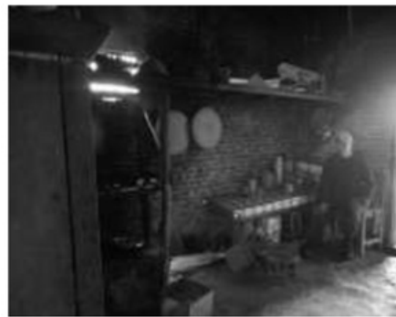
Gambar 4 Contoh dapur yang biasa dipakai untuk berkumpul dan