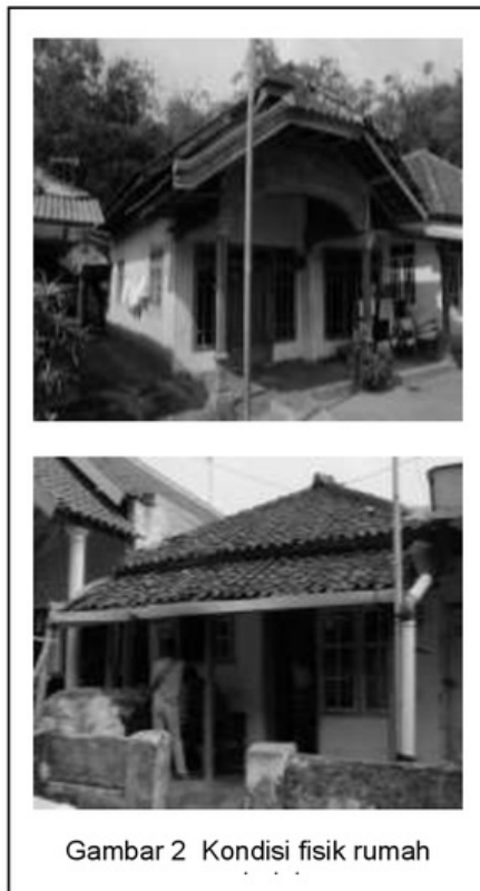
Gambar 2 Kondisi fisik rumah

Kondisi bangunan pada lokasi penelitian sebagian besar sudah bersifat permanen dengan menggunakan material dari bahan batu bata dan kayu. Sedangkan untuk bahan penutup lantai terbuat dari keramik dan plesteran semen. Sifat bahan akan sangat menentukan dalam terciptanya tingkat kenyamanan di dalam bangunan, kemampuan bahan dalam merespon kondisi lingkungan luar harus sesuai, apakah bahan tersebut dapat cepat melepas dan menyerap panas atau lambat dalam menyerap dan melepas panas, hal ini tergantung pada konstruksi dari bahan tersebut. Semakin tebal dan padat konstruksi suatu bahan, maka semakin lambat dalam merespon kondisi lingkungan. Dengan pemilihan material bangunan yang terbuat dari bahan permanen diharapkan mampu mempertahankan kondisi termal bangunan agar tidak mudah terpengaruh kondisi udara di luar rumah dengan temperatur udara yang lebih rendah dan kelembaban udara yang tinggi.