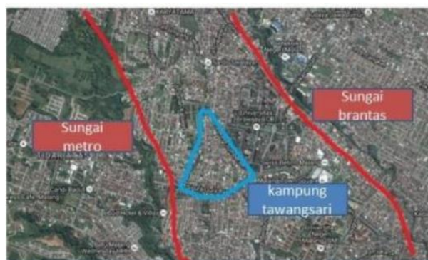
Gambar. 1 Peta Kelurahan Summersari

Secara administratif, Kelurahan Summersari dikelilingi oleh kelurahan lainnya yang ada di Kota Malang antara lain. Kelurahan Summersari secara administratif sebelah utara berbatasan dengan dengan kelurahan ketawanggede dan Kelurahan Dinoyo, Kecamatan Lowokwaru. Di sebelah timur