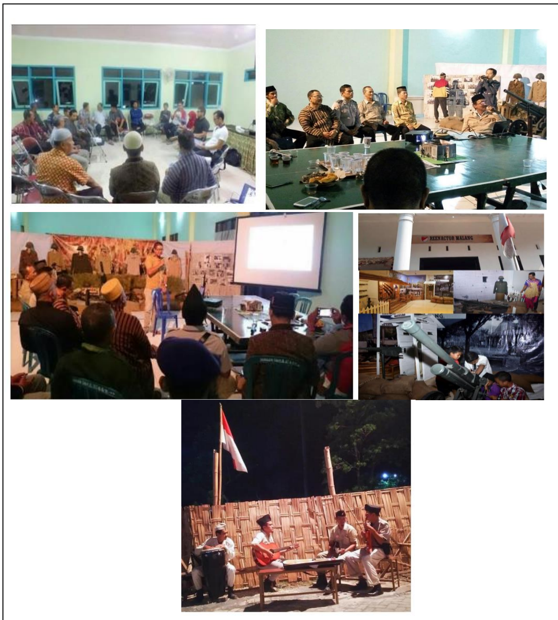
Gambar 3. Kegiatan Masyarakat Summersari

Dengan adanya dukungan dan pemahaman dari seluruh elemen warga, serta dukungan dari stakeholder pemerintahan kemasyarakatan sehingga kemampuan mewujudkan Kampung sejarah di kelurahan Summersari ini bisa direalisasi dengan diawali pelaksanaan Festival Kampoeng Tawang Sari yang dilaksanakan satu tahun sekali secara swadaya dengan memanfaatkan segala sumber daya dan kemampuan yang dimiliki warga Tawang Sari sendiri. Kegiatan sosial ini diharapkan dapat diselenggarakan setiap tahunnya dan masyarakat Summersari diberikan pembinaan dan pendampingan dari stakeholder terkait untuk pengembangan lebih lanjut agar ide-ide masyarakat tersebut bisa terealisasi. Desain Partisipatori dapat dikatakan sebagai desain yang dikerjakan secara bersama-sama yang dapat dijadikan salah satu alternatif metode dalam merancang produk arsitektur yang berwasawan lingkungan dan sosial yang memiliki kondisi obyek perancangan dengan kultur sosial yang beragam.