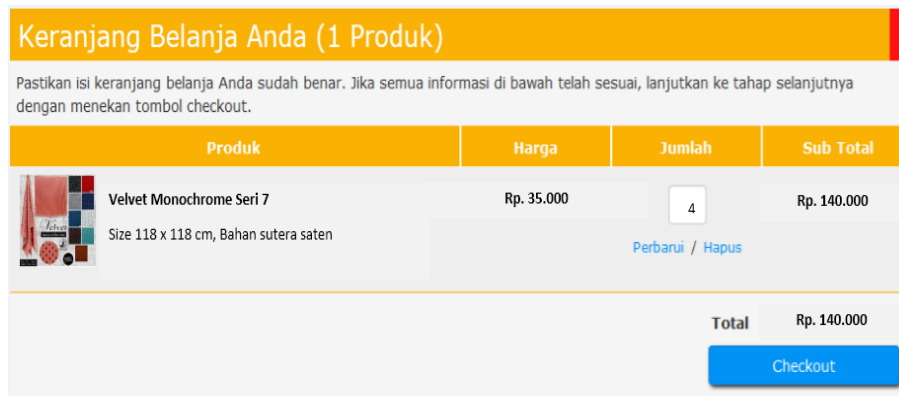
Gambar 5. Halaman Menu keranjang belanja