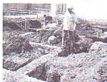
Gambar 1 Lokasi I: Perum Ijen Nirwana Regency, Malang

80%, memiliki curah hujan yang relatif tinggi ( \pm 141 mm/th), dan memiliki kecepatan angin rata – rata 1.8 – 2.0 m/s. Adapun objek amatan dibatasi pada pekerjaan pondasi pada 4 buah lokasi perumahan pada kota Batu (Griya Taman Asri, Permata Regency) dan Malang (Ijen Nirwana Regency, Green Hill Residences, Wastu Asri) dengan mengambil 15 objek pada tiap – tiap kota. Berikut ini adalah beberapa dokumentasi yang dilakukan pada objek penelitian.