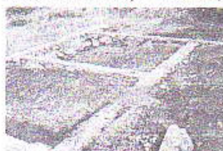
Gambar 2 Lokasi II: Perum Griya Taman Asri, Batu