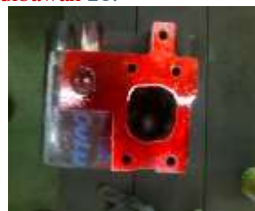
Gambar 21 Foto permukaan cylinder head setelah diberi penetrant

metal) dengan logam lasnya (weld metal) walaupun telah dilakukan proses cutting dengan mesin milling. Hal ini disebabkan karena perbedaan material antara base metal dan weld metalnya sehingga untuk penyeragaman warna sulit didapatkan. Yang terpenting adalah permukaan tersebut sudah sangat rata dan diukur dengan dial indikator. Logam las dan logam induk sulit untuk diseragamkan warnanya karena perbedaan material yang digunakan. Sebelum dilakukan penyemprotan dengan penetrant permukaan harus dibersihkan dulu dengan thinner/cleaner. Selanjutnya disemprotkan penetrant secukupnya seperti terlihat pada gambar dibawah 21.