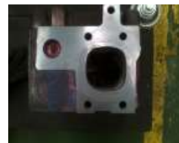
Gambar 20 Foto permukaan cylinder head setelah proses cutting

Pengujian ini dilakukan untuk mengetahui adanya indikasi crack atau porositas pada bagian permukaan cylinder head. Alat uji yang digunakan adalah spotcheck dye penetrant merupakan salah satu pengujian tidak merusak (Non Destructive Test). Berikut ditunjukkan pada gambar 20 cylinder head sebelum dilakukan pengujian.