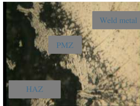
Gambar 24 Struktur mikro pada base metal, haz, dan weld metal (Perbesaran 400x)