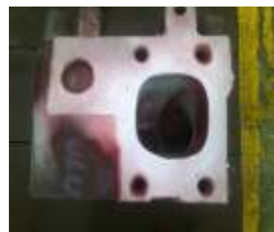
Gambar 22 Foto permukaan cylinder head setelah diberi developer

Diamkan beberapa saat hingga cairan penetrant meresap merata. Kira-kira sekitar ±15 menit, semakin lama dibiarkan maka semakin bagus karena cairan benar-benar meresap. Tahapan ini sangat penting sebagai penentu keberhasilan pengujian. Selanjutnya pemberian developer seperti gambar dibawah 22.