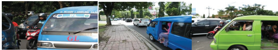
Gambar 1. Bentuk mobil angkutan kota beserta penumpang dan kepadatan jalan raya