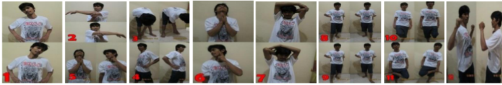
Gambar 2. Gerakan Stretching