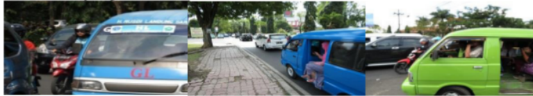
Gambar 1. Bentuk mobil angkutan kota beserta penumpang dan kepadatan jalan raya

Adalah mobil sejenis APV atau Cerry , 1600 cc (Gambar 1.) dengan desain interior terdapat kursi di bagian depan dapat diisi oleh 2 penumpang dan di bagian belakang kapasitas kurang lebih 10 penumpang. Selain itu juga terdapat kursi tambahan jika penumpang membludak. Di bagian belakang terdapat sound berukuran sedang. Dibagian depan terdapat tempat Compact Disk (CD) , sound kecil dan sebuah kotak untuk menyimpan sesuatu.