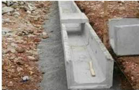
Gambar 8. Hasil Pendampingan Perencanaan Sistem Drainase

Rekomendasi yang diberikan oleh tim pengabdian kepada warga untuk mengatasi permasalahan peningkatan infrastruktur jalan lingkungan dengan pavingisasi yaitu dengan memberikan nasehat teknis berupa penggunaan bentuk paving dan cara pemasangan sesuai dengan gambar 7.