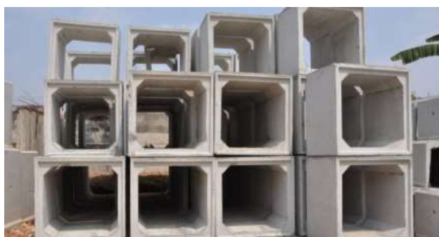
Gambar 6. Box Culvert Bentuk Persegi

Sementara itu penelusuran literatur yang berhubungan dengan perbaikan sistem drainase juga dikerjakan untuk mencari solusi permasalahan yang dihadapi warga RT 08 RW 02 Kelurahan Merjosari Kota Malang, dimana salah satu yang saat ini sedang menjadi trending adalah penggunaan box culvert . Box culvert adalah salah satu jenis beton precast yang sering digunakan pada konstruksi saluran air (gorong-gorong), dimana beton precast atau beton pracetak merupakan salah satu material konstruksi yang banyak digunakan karena kelebihan-kelebihan yang dimiliki (Asiacon, 2018). Secara umum, box culvert merupakan konstruksi yang menyerupai pipa persegi atau persegi panjang yang terbuat dari beton bertulang guna memperkuat konstruksi memikul beban di atasnya dengan tipikal rancangan sesuai kondisi lapangan, kegunaan, estetika, kekuatan dan sisi ekonomis (gambar 6) (Subiyanto, 2014; Asiacon, 2018).