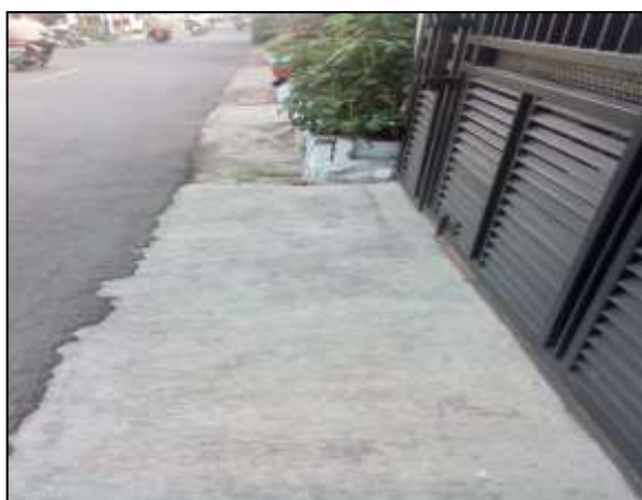
Gambar 1. Jalan Lingkungan di wilayah RT 08 RW 02 Kelurahan Merjosari Kota Malang

Wilayah RT 08 RW 02 Kelurahan Merjosari Kota Malang merupakan kawasan yang dilingkupi oleh beberapa perguruan tinggi sehingga sarana transportasi menjadi salah satu faktor vital untuk mendukung mobilitas warga masyarakat. Sebagai kawasan padat pendatang baru, fasilitas jalan di wilayah RT 08 RW 02 Kelurahan Merjosari Kota Malang turut berperan untuk kegiatan mobilisasi warga bahkan hingga jalan-jalan lingkungan di luar jalan utama, sehingga keberadaan jalan lingkungan sebagai jalan alternatif maupun penghubung antar warga masyarakat memerlukan perhatian dan peningkatan kualitas dari jalan tanah sehingga lebih layak bagi kegiatan transportasi warga setempat. Kondisi jalan lingkungan di wilayah RT 08 RW 02 Kelurahan Merjosari Kota Malang yang memerlukan perbaikan untuk memenuhi fungsi kelayakan jalan seperti tercantum pada gambar 1.