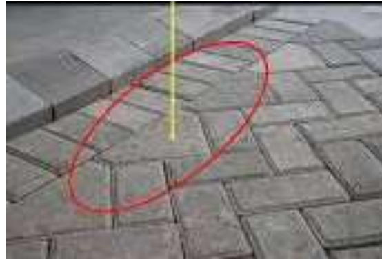
Gambar 7. Hasil Pendampingan Perencanaan Sistem Jalan Lingkungan

Rekomendasi yang diberikan oleh tim pengabdian kepada warga untuk mengatasi permasalahan peningkatan infrastruktur jalan lingkungan dengan pavingisasi yaitu dengan memberikan nasehat teknis berupa penggunaan bentuk paving dan cara pemasangan sesuai dengan gambar 7.