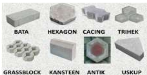
Gambar 4. Bentuk Paving Block

Pola pemasangan dari paving block menyesuaikan dengan tujuan penggunaannya. Untuk perkerasan jalan umumnya diutamakan menggunakan pola tulang ikan karena pola ini memiliki kunci yang baik dengan susunan tepian pavingan menggunakan pasak berbentuk topi uskup (gambar 5) (Fitriana, 2016).