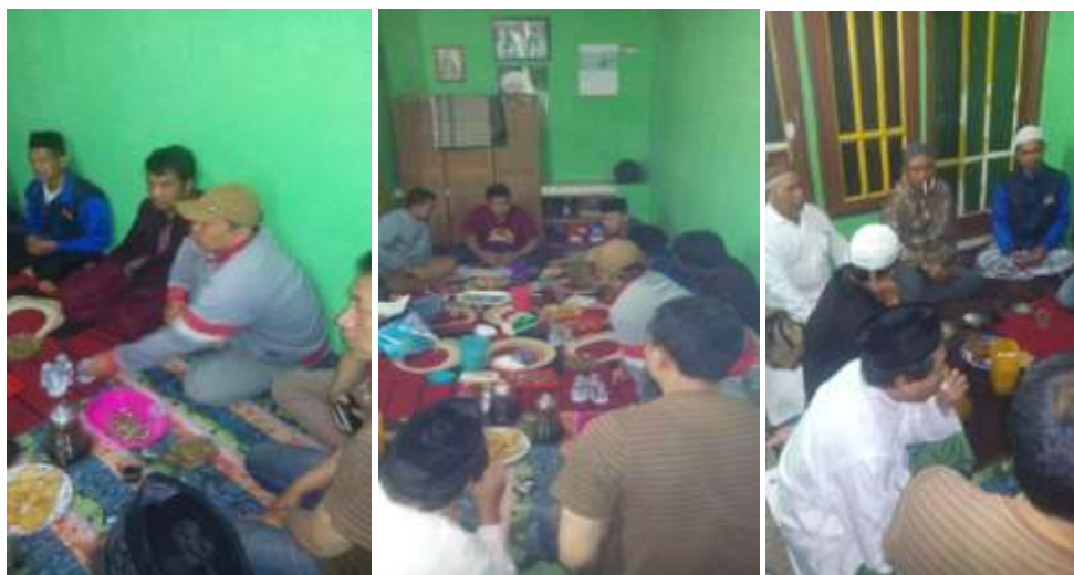
Gambar 3. Kegiatan Diskusi Dengan Warga Setempat

Berdasarkan pada permasalahan yang terjadi di lingkungan RT 08 RW 02 Kelurahan Merjosari Kota Malang, maka pengurus RT bermaksud untuk mengajukan proposal kepada Pemerintah Kota Malang dalam bentuk Usulan Kegiatan Pembangunan Prioritas Kelurahan (UKPPK) tahun 2019. Mengingat banyaknya usulan kegiatan yang diajukan oleh wilayah-wilayah lain di kota Malang, maka Pemerintah Kota melakukan seleksi untuk menentukan kegiatan yang berhak mendapatkan pendanaan.