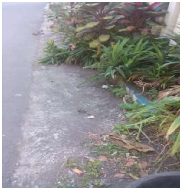
Gambar 2. Kondisi Jalan yang Memerlukan Peningkatan Sistem Drainase

Pada saat ini dengan adanya penduduk pendatang, berdampak pada tingkat perekonomian warga wilayah ini juga makin meningkat, namun disisi yang lain juga meningkatkan air sisa buangan dari tiap-tiap hunian warga yang membebani sistem drainase wilayah RT 08 RW 02 Kelurahan Merjosari Kota Malang. Beban saluran drainase semakin meningkat jika musim penghujan tiba karena berkurangnya area serapan air hujan sehingga air dari saluran drainase dapat melimpas hingga membanjiri wilayah jalan utama dan jalan lingkungan. Tentu saja hal ini juga berdampak buruk bagi fasilitas jalan yang mengalami kerusakan lebih cepat dibandingkan dengan umur yang direncanakan akibat adanya limpasan air yang secara terus menerus melalui jalan tersebut. Potret jalan di wilayah RT 08 RW 02 Kelurahan Merjosari Kota Malang yang memerlukan peningkatan sistem drainase yang lebih baik seperti terlihat pada gambar di bawah ini.