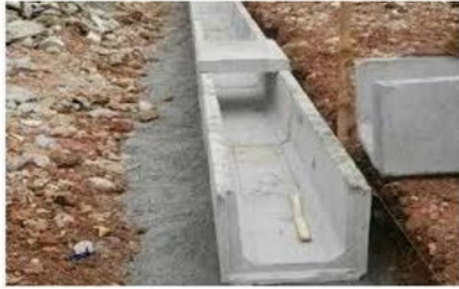
Gambar 8. Hasil Pendampingan Perencanaan Sistem Drainase

Berkaitan dengan peningkatan sistem drainase sesuai dengan nasihat teknis berupa penggunaan box culvert sebagai saluran air drainase yang diusulkan, maka untuk pelaksanaannya direkomendasikan penggunaan box culvert dengan model U dengan metode pelaksanaan seperti tercantum pada gambar 8.