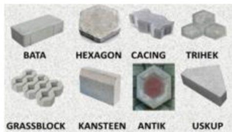
Gambar 4. Bentuk Paving Block

Berdasarkan SK SNI T-04-1 1 90-F seperti yang tercantum dalam (Khoirunnisah, 2015), bentuk dari paving block dapat dibedakan menjadi dua, yaitu segi empat dan segi banyak (gambar 4.)