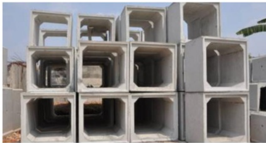
Gambar 6. Box Culvert Bentuk Persegi

Sementara itu penelusuran literatur yang berhubungan dengan perbaikan sistem drainase juga dikerjakan untuk mencari solusi permasalahan yang dihadapi warga RT 08 RW 02 Kelurahan Merjosari Kota Malang, dimana salah satu yang saat ini sedang menjadi trending adalah penggunaan box culvert . Box culvert adalah salah satu jenis beton precast yang sering digunakan pada konstruksi saluran air (gorong-gorong), dimana beton precast atau beton pracetak merupakan salah satu material konstruksi yang banyak digunakan karena kelebihan-kelebihan yang dimiliki (Asiacon, 2018). Secara umum, box culvert merupakan konstruksi yang menyerupai pipa persegi atau persegi panjang yang terbuat dari beton bertulang guna memperkuat konstruksi memikul beban di atasnya dengan tipikal rancangan sesuai kondisi lapangan, kegunaan, estetika, kekuatan dan sisi ekonomis (gambar 6) (Subiyanto, 2014; Asiacon, 2018).