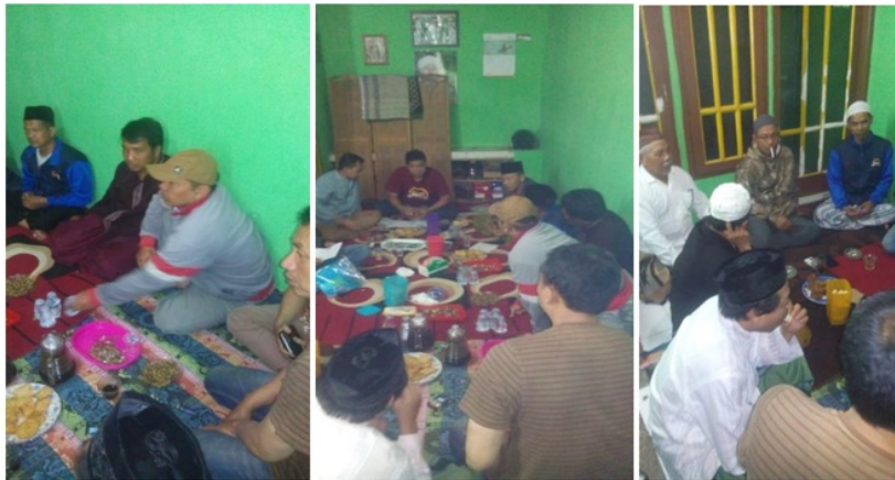
Gambar 3. Kegiatan Diskusi Dengan Warga Setempat