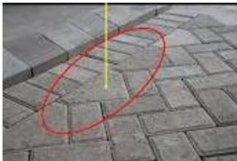
Gambar 7. Hasil Pendampingan Perencanaan Sistem Jalan Lingkungan

Berdasarkan kajian yang dilakukan oleh tim pengabdian masyarakat, maka dihasilkan perencanaan teknis sistem jalan lingkungan dan sistem drainase seperti tercantum pada gambar 7 dan Gambar 8.