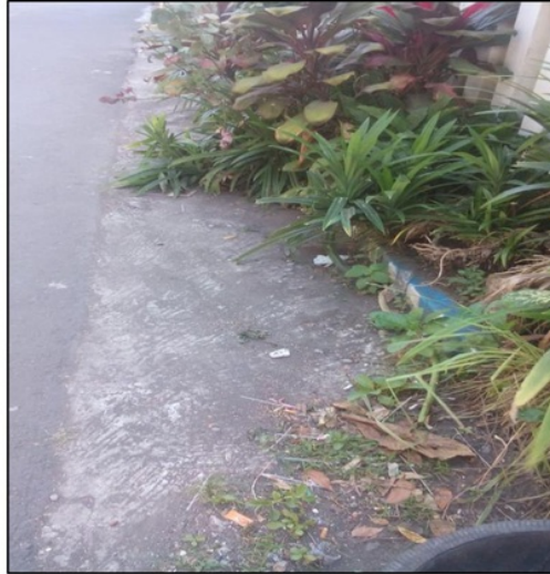
Gambar 2. Kondisi Jalan yang Memerlukan Peningkatan Sistem Drainase

dan jalan lingkungan. Tentu saja hal ini juga berdampak buruk bagi fasilitas jalan yang mengalami kerusakan lebih cepat dibandingkan dengan umur yang direncanakan akibat adanya limpasan air yang secara terus menerus melalui jalan tersebut. Potret jalan di wilayah RT 08 RW 02 Kelurahan Merjosari Kota Malang yang memerlukan peningkatan sistem drainase yang lebih baik seperti terlihat pada gambar 2.