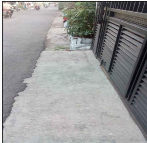
Gambar 1. Jalan Lingkungan di wilayah RT 08 RW 02 Kelurahan Merjosari Kota Malang

baru, fasilitas jalan di wilayah RT 08 RW 02 Kelurahan Merjosari Kota Malang turut berperan untuk kegiatan mobilisasi warga bahkan hingga jalan-jalan lingkungan di luar jalan utama, sehingga keberadaan jalan lingkungan sebagai jalan alternatif maupun penghubung antar warga masyarakat memerlukan perhatian dan peningkatan kualitas dari jalan tanah sehingga lebih layak bagi kegiatan transportasi warga setempat. Kondisi jalan lingkungan di wilayah RT 08 RW 02 Kelurahan Merjosari Kota Malang yang memerlukan perbaikan untuk memenuhi fungsi kelayakan jalan seperti tercantum pada gambar 1.