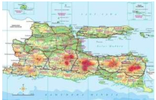
Peta Jawa Barat