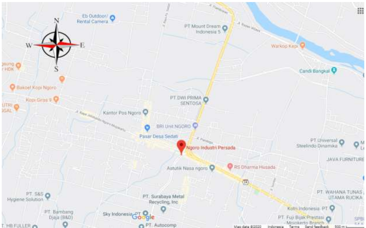
Gambar 1.1 Peta Lokasi Pabrik Magnesium Klorida