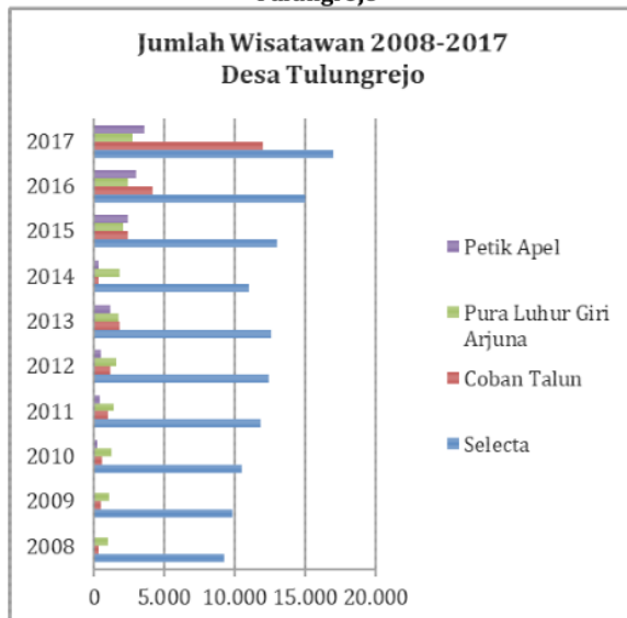
Grafik 2. Jumlah Wisatawan Tahun 2008-2017 Desa Tulungrejo

Meskipun berkurangnya satu wisata di desa tulungrejo, tidak mempengaruhi jumlah kunjungan wisatawan pada desa tulungrejo ini. Hal ini tetap memberikan nilai positif bagi sektor pariwisata yang ada di Desa Tulungrejo.