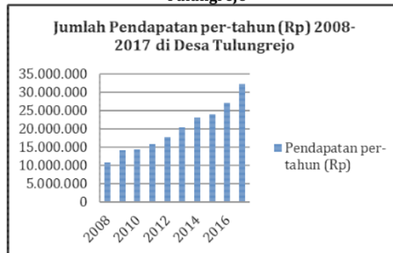
Grafik 3. Jumlah Pendapatan Per- Tahun 2008-2017 Desa Tulungrejo

Dari hasil kuisisioner didapatkan jumlah rata-rata masyarakat yang disekitar wisata pertahunnya mulai tahun 2008 - 2017, dapat dilihat pada grafik 3.