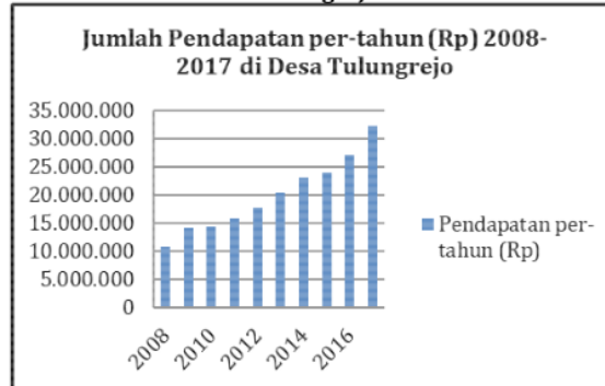
Grafik 3. Jumlah Pendapatan Per- Tahun 2008-2017 Desa Tulungrejo

Dari hasil kuisisioner didapatkan jumlah rata-rata masyarakat yang disekitar wisata pertahunnya mulai tahun 2008 – 2017, dapat dilihat pada grafik 3.