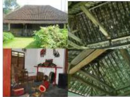
Gambar. 4.11 Rumah Kuno Masyarakat Biasa