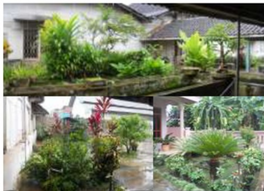
Gambar. 4.8 .Vegetasi Sakral Rumah sepuh desa Sumber. Dokumen 2012

Vegetasi yang ada di Desa Kromengan memiliki 5 jenis tanaman yaitu: (1).Tanaman hias. seperti palem, rumput gajah, lily putih dan kembang kertas. (2).Tanaman Sakral (lansekap Jawa) seperti yang ada di punden dan dirumah sesepuh desa yaitu pohon beringin, puring, andong, pisang, jambe, mawar, kenanga, jolokusumo, soka dan pandan, (3).Tanaman obat-obatan, (4).Tanaman Buah-buahan, dan (5).Tanaman produktif pertanian