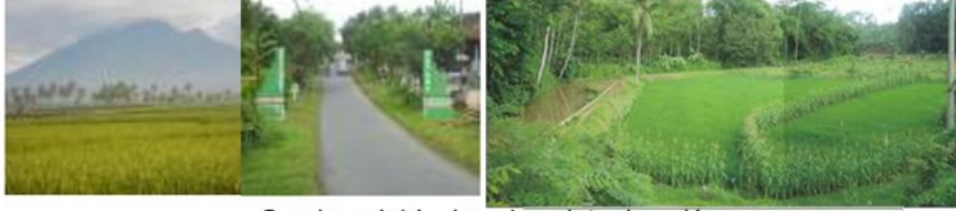
Gambar. 4.14. view dan vista desa Kromengan Sumber. Dokumentasi 2012

seperti hamparan sawah, pegunungan yang sangat menarik dan juga permukimannya.