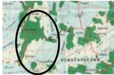
Gambar. 4.3 Pola permukiman Grid Desa Kromengan