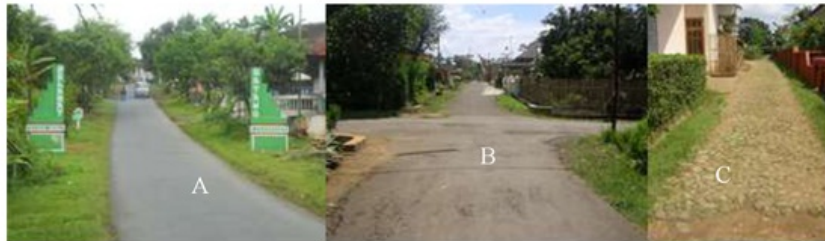
Gambar. 4.6 .Sirkulasi Jalan (A) Aspal (B)Aspal (C) Stapak bebatuan

Sirkulasi Desa Kromengan memiliki pola grid pada masing-masing pedukuhan, pola grid membentuk blok-blok rumah. Sedangkan antar pedukuhan pola sirkulasinya berbentuk linier dengan menggunakan jalan kecamatan (aspal), untuk sirkulasi antar RW dan RT dimasing-masing menggunakan aspal dan jalan setapak.