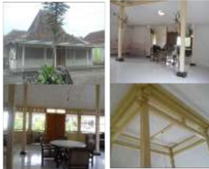
Gambar. 4.10. Rumah Kuno Mantan Kepala Desa Sumber. Dokumentasi 2012