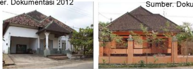
Gambar. 4.12. Rumah Modern Sumber. Dokumentasi 2012

Desa Kromengan juga dilengkapi dengan fasilitas umum berupa perkantoran baik kecamatan, kelurahan serta sarana dan prasarana (sekolah dan tempat peribadatan).