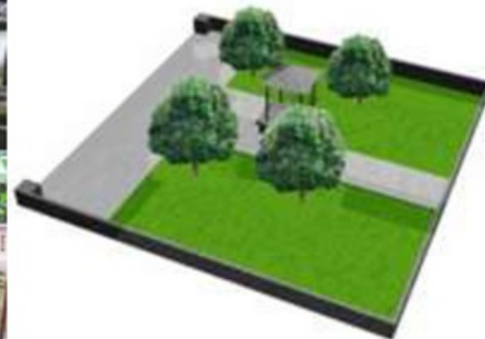
Gambar. 4.9 .vegetasi sakral punden