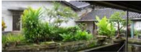
Gambar. 4.15. Kolam Ikan Penghias Tanaman Sumber. Dokumentasi 2012

Fitur –fitur air yang terdapat pada desa Kromengan merupakan fitur alami dari sungai, sumur dan sumber air desa. Untuk fitur air buatan hanya ada beberapa di masing rumah tinggal yaitu dengan adanya kolam ikan sebagai penghias taman rumah.