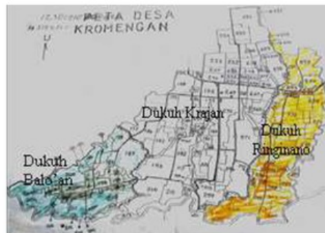
Gambar. 4.1 Pembagian wilayah Desa Kromengan

Desa Kromengan terletak di Kecamatan Kromengan, Kabupaten Malang. Secara geografis, Desa Kromengan terletak pada posisi 08°05" LS dan 112°-27.7510' BT, dengan topografi ketinggian berada di dataran sedang yaitu 400 meter dpl. Luas wilayah 735,814 Ha. Wilayah terbagi atas beberapa peruntukan lahan diantaranya permukiman, pertanian kegiatan ekonomi, fasilitas umum dan lain-lain. Secara administratif, Desa Kromengan terbagi menjadi tiga wilayah, yaitu Dukuh Ringinanom, Dukuh Krajan dan Dukuh Baloan (Gambar. 4.1)