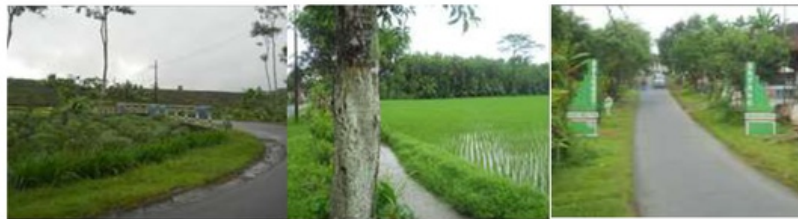
Gambar. 4.16. Gapura selamat datang , jembatan dan pematang sawah

Fitur–Fitur berskala kecil Desa Kromengan ditunjukkan pada gapura keluar masuk kawasan (gapura selamat datang), pagar pembatas pada masing masing hunian, pagar jembatan serta batas antar pematang sawah.