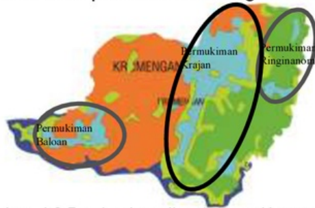
Gambar. 4.2 Pembagian wilayah Desa Kromengan

Organisasi keruangan Desa Kromengan terbagi menjadi dua yaitu; (1).Organisasi keruangan dengan pola terpusat dan menyebar di masing masing pedukuhan, keruangan dukuh Krajan, keruangan dukuh Baloan dan keruangan dukuh Ringinanom (Gambar.4.2). (2).Organisasi keruangan dengan pola grid di dalam kawasan permukimannya berupa blok blok permukiman dengan batas jalan raya (Gambar4.3).