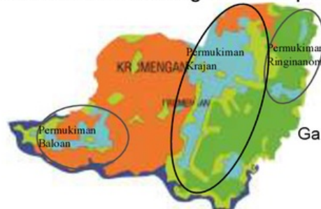
Gambar. 4.5 Pembagian wilayah Desa Kromengan

Penataan Cluster sesuai dengan pembagian wilayah yang terbagi menjadi 3 pedukuhan; Krajan, Baloan dan Ringinanom (Gambar 4.5). Dalam wilayah pedukuhan tersebut terbagi lagi menjadi beberapa RT dan RW dan terus berkembang terutama pada permukiman.