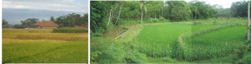
Gambar. 4.7 .Sawah di Desa Kromengan Sumber. Dokumentasi 2012

terutama sawah ladangnya berkontur sedang dengan bentuk lahan yang berundak-undak.