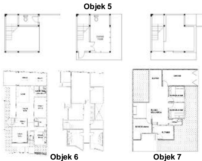
Gambar. 1. Hasil desain denah objek penelitian