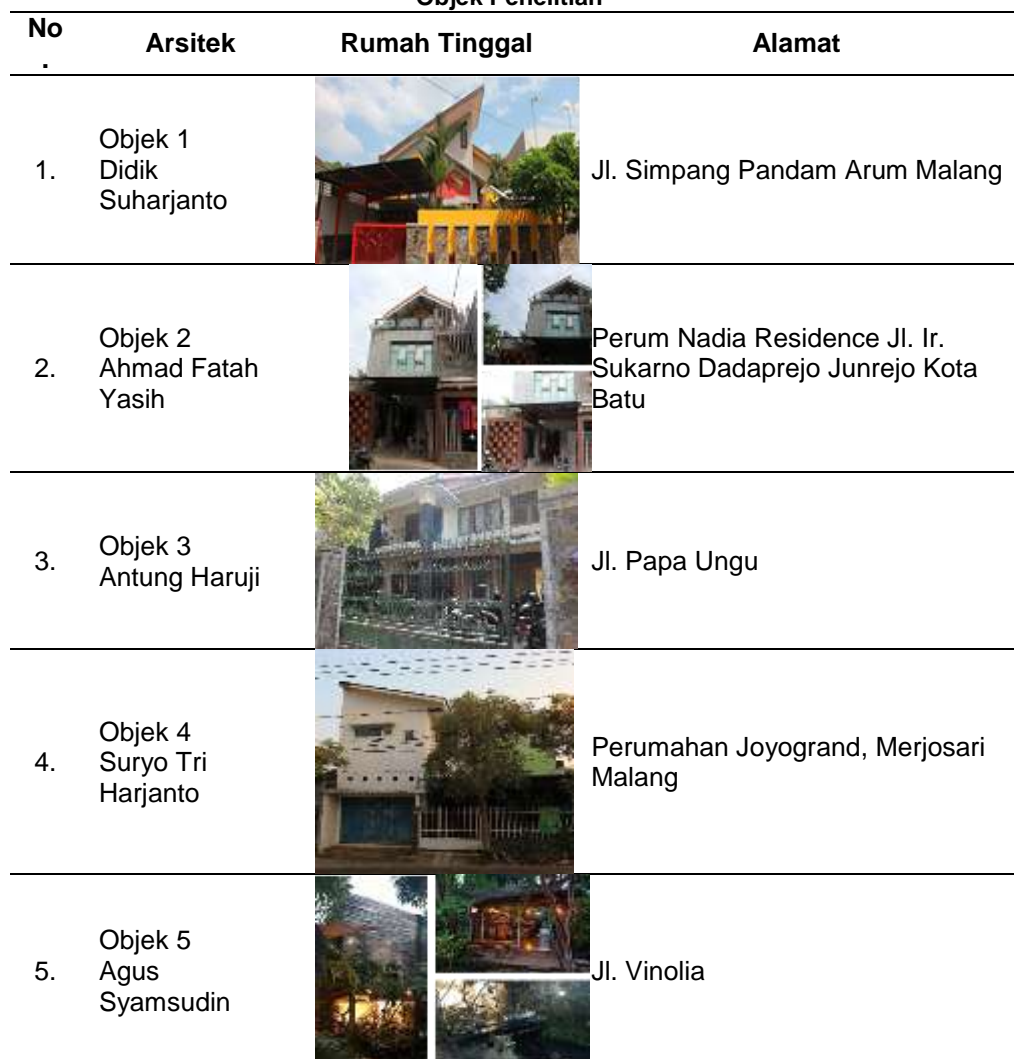
Tabel 1. Objek Penelitian

Objek penelitian merupakan rumah tinggal yang merupakan hasil karya penghuni/arsitek itu sendiri. Berikut ini objek penelitian sementara yang akan diteliti, jumlah objek penelitian dapat bertambah berdasarkan kriteria dan informasi yang didapatkan dari daftar objek penelitian sementara sesuai teknik snowball sampling (Tabel 1).