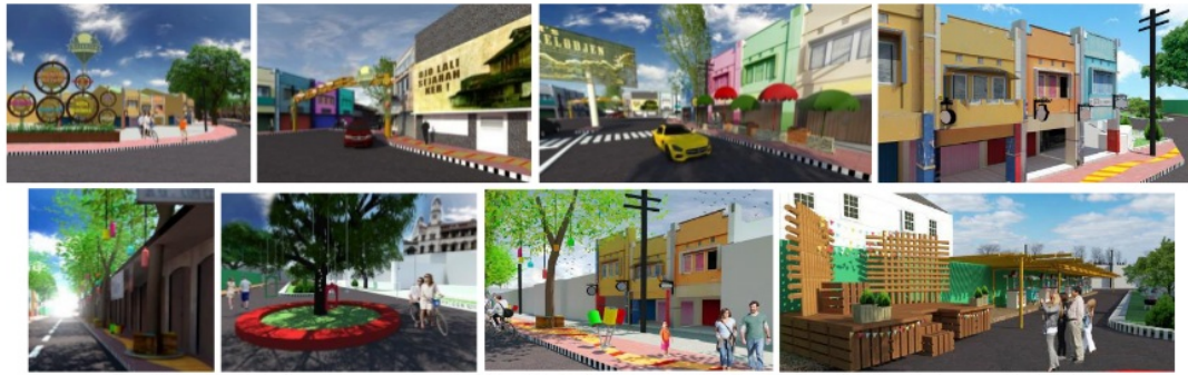
Gambar 4. Usulan konsep desain street furniture pada lokasi objek studi. (Analisis penulis, 2019)

Selanjutnya, evaluasi konsep desain terkait prinsip tatanan elemen fisik sarana dan prasarana pejalan kaki pada kawasan sepanjang Jl.