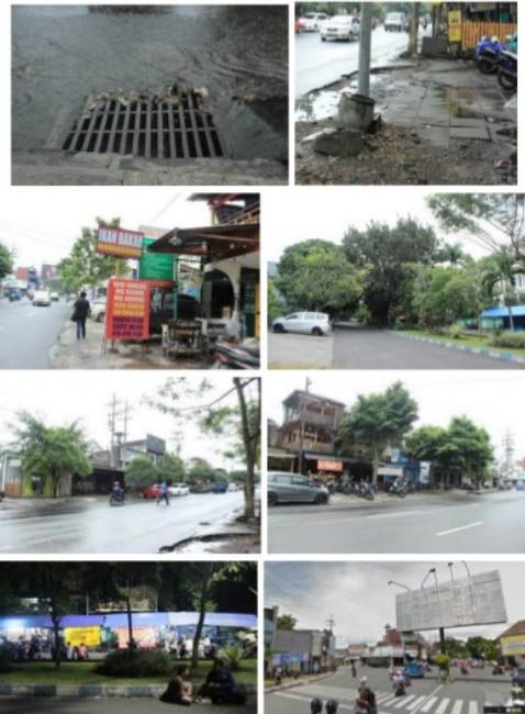
Gambar 3. Street furniture eksisting. (Dokumentasi penulis, 2019)

Permasalahan eksisting, diantaranya kondisi pedestrian sidewalk banyak yang rusak dan banyak dijadikan lahan parkir oleh pengunjung terutama pada Jl. Trunojoyo sehingga kurang nyaman bagi pejalan kaki; marka diffable tidak ada; area PKL kurang tertata di Jl. Dr. Sutomo; elemen penanda kurang berkarakter; halte tidak ada; serta tempat sampah masih belum dibedakan antara sampah organik, anorganik, dan B3.