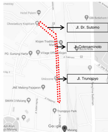
Gambar 4. Lokasi objek amatan; area sepanjang Jl. Trunojoyo - Jl. Cokroaminoto - Jl. Dr. Sutomo, Kelurahan Klojen, Kota Malang. (Analisis penulis, 2019)

Objek studi kasus kajian ini, yaitu area pedestrian sidewalk "Klojen Kuliner Heritage" sepanjang Jl. Trunojoyo, Jl. Cokroaminoto, hingga Jl. Dr. Sutomo, Kelurahan Klojen, Kecamatan Klojen, Kota Malang yang merupakan sepuluh (10) nominator terbaik pada "Lomba Kampung Tematik - Festival Rancang Malang 2016".