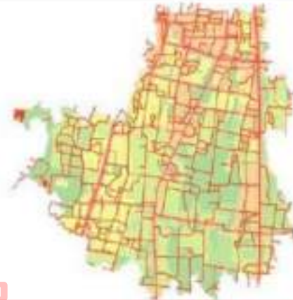
Gambar 2. Peta digital jaringan Jalan dan Zona Nilai Tanah Kec. Sewon

Peta digital tata guna lahan, administrasi, dan persebaran fasilitas umum kecamatan sewon dari kantor BAPPEDA Kab. Bantul, dengan format shapefile (*.shp) dengan datum WGS 1984 dan sistem proyeksi Universal Transverse Mercator zone 49s, persebaran fasilitas umum diluar kecamatan sewon yang masih mempengaruhi nilai tanah di kecamatan sewon juga dipilih.