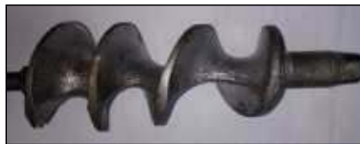
Gambar 3. Ulir penggiling

Ulir penggiling merupakan komponen didalam tabung giling. Ulir penggiling ini memiliki fungsi sebagai penjalan bahan yang akan digiling ke mata pisau. diameter ulir penggiling ini 14 cm dan memiliki panjang 35 cm dengan jarak regangan 25 mm. bahan ulir penggiling dari stainless steel dengan proses pembentukan ulir menggunakan mesin bubut.