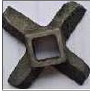
Gambar 4. Mata pisau