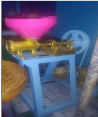
Gambar 2. Mesin penggiling sambel pecel

Setelah dilakukan proses reverse engineering dimana ada 3 tahapan yaitu, disassembly, assembly dan benchmarking dilakukan perhitungan – perhitungan untuk proses pembuatan. Sebelum proses pembuatan dilakukan, mendesain terlebih dahulu menggunakan software inventor. Dengan dimensi ukuran yang sudah lengkap, proses selanjutnya adalah pembuatan mesin giling sambel pecel seperti gambar 2.