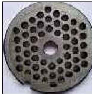
Gambar 5. Plat saringan

Plat saringan berfungsi sebagai penahan bahan baku agar hasil cacahan bahan baku bisa maksimal. Kasar halusnya hasil cacahan tergantung pada diameter plat saringan. Plat saringan terbuat dari bahan stainless steel dengan diameter 15 cm dan tebal 5mm. pada plat saringan mesin giling sambel pecel yang dirancang ini memiliki diameter saringan 2 mm.